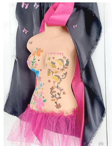
EL CÁNCER de mama si se detecta tiempo es curable al 100%.

Conforme al sexo masculino, señaló que en los 13 años que lleva la clínica en el municipio de Palenque, no se ha detectado algún caso de cáncer de mama, aunque lamentó que, en estos años solamente han acudido cerca de 10 hombres a hacerse estos estudios.