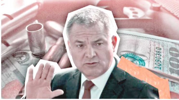
GENARO GARCÍA Luna fue detenido en 2019 en Texas y actualmente se encuentra en Nueva York, donde fue sentenciado a 38 años.

•El exsecretario de Seguridad Pública de Felipe Calderón es culpable de cinco cargos, cuatro de ellos relacionados con el narcotráfico