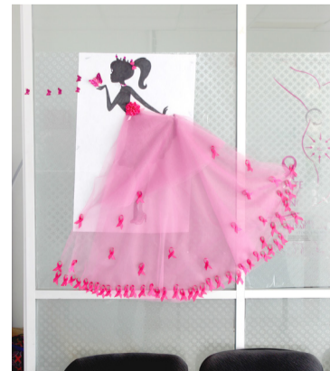
MUJERES DE 10 municipios y demás acuden a la clínica de la mujer a atenderse.