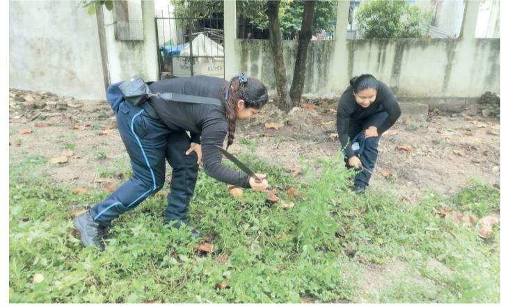
CONTINÚAN LOS trabajos de limpieza y rescate de espacios públicos.