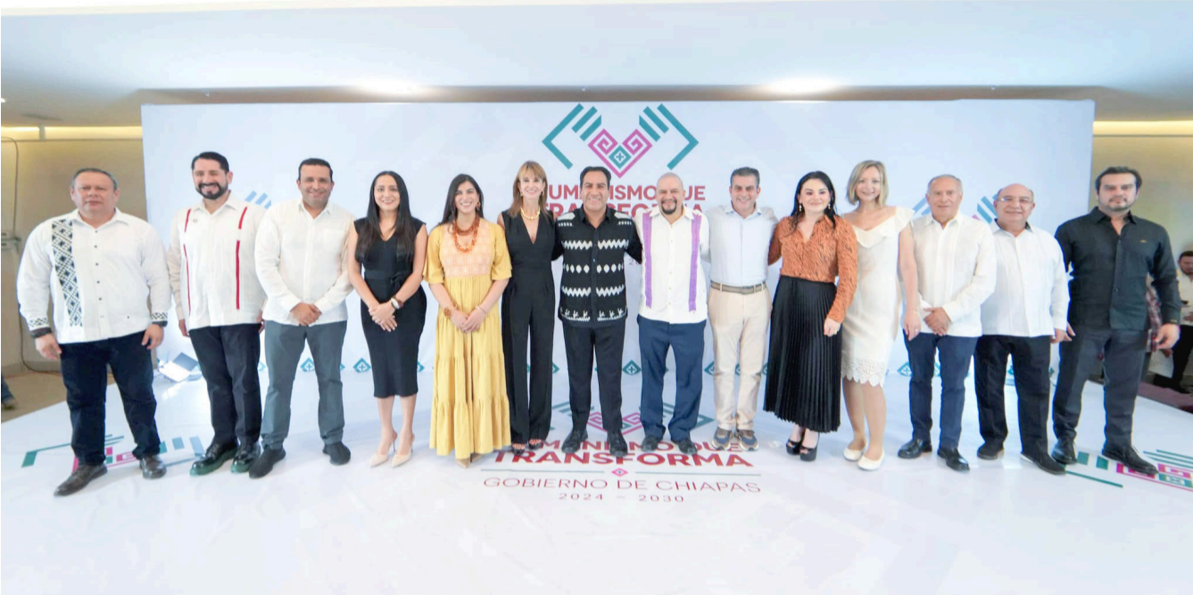
ERA LLAMÓ a los nuevos funcionarios a trabajar con transparencia y honestidad