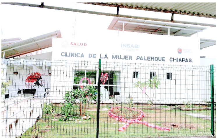
ESTE JUEVES la clínica de la mujer realizará su jornada de colposcopia.