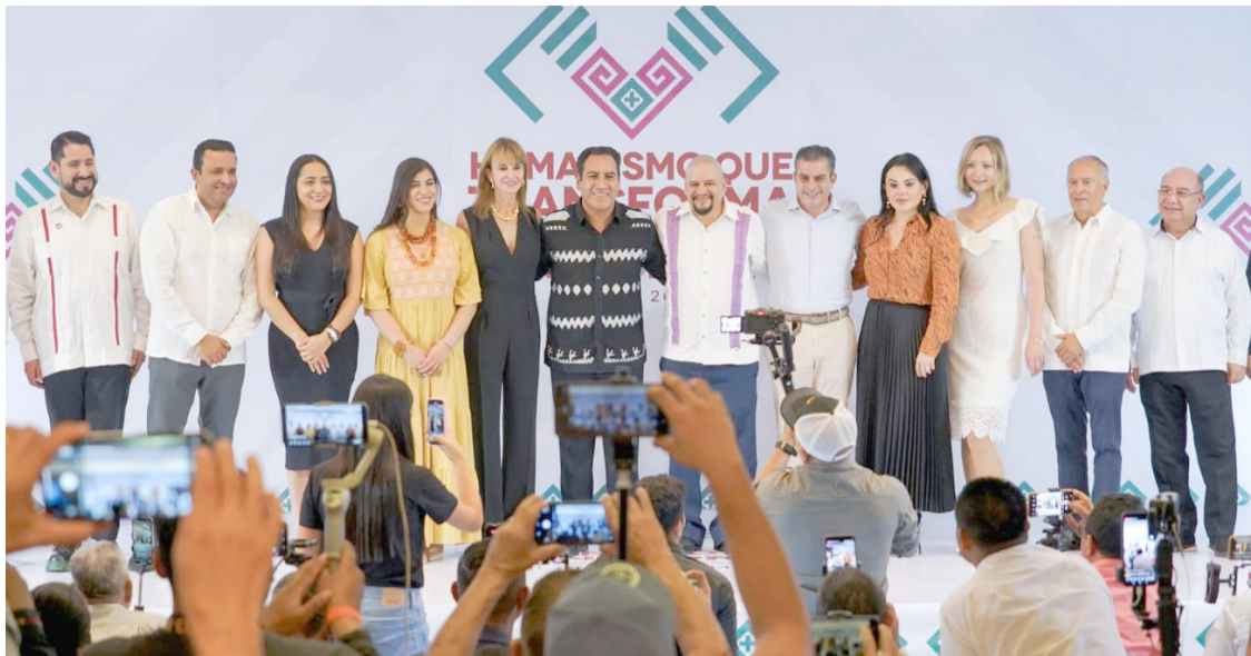
ERA DESTACÓ que impulsará en el inicio de su gobierno el programa más ambicioso de educación para Chiapas.