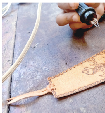
ES IMPORTANTE rescatar este patrimonio cultural que se va perdiendo.