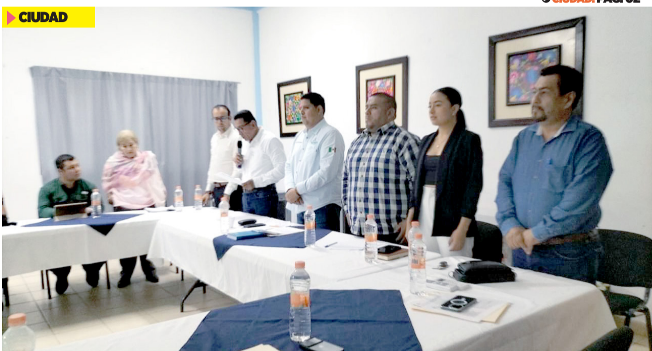
PARA EL Fortalecimiento de la seguridad y en beneficio de todas las familias del municipio de Palenque.

•El Presidente Municipal presidió la Instalación y Primera Sesión Ordinaria del Consejo Municipal de Seguridad Pública CIUDAD. PÁG. 02