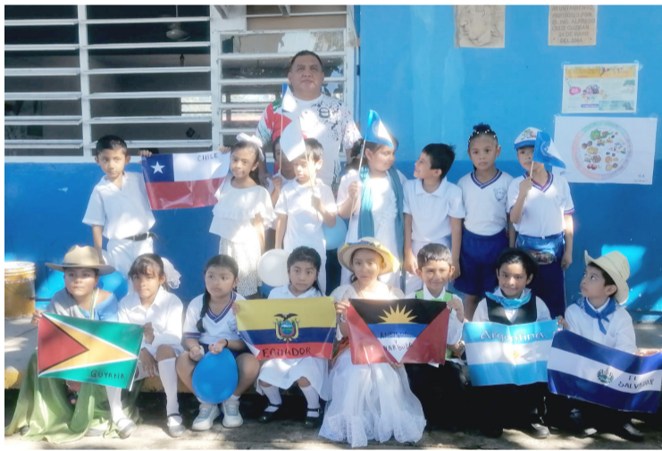
ALUMNOS DE la escuela primaria Cultura Maya desfilaron por las calles del centro de Palenque.