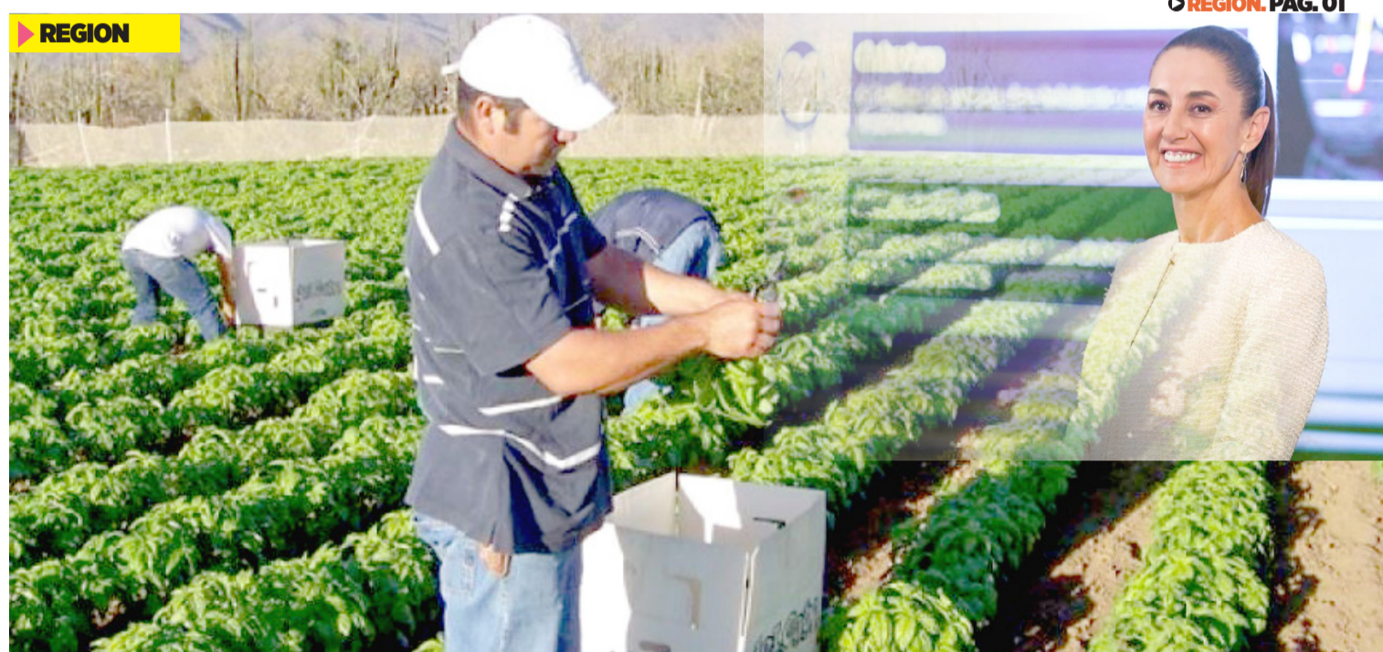
TECNIFICACIÓN del riego; garantizar el precio de maíz y tortilla; garantizar autosuficiencia de semillas.

•Producir lo que consumimos y también tener alimentos saludables y a buenos precios para las familias mexicanas, aseveró la presidenta