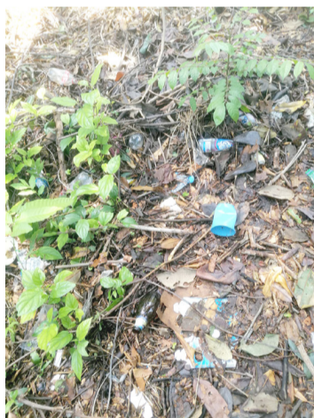
EL HORARIO para sacar la basura es de 18:00 a 18:30 horas, acuerdos al que llegaron empresarios y autoridades del ayuntamiento.

Sin embargo y pese a que existe la lona, hay personas que continúan con las malas prácticas