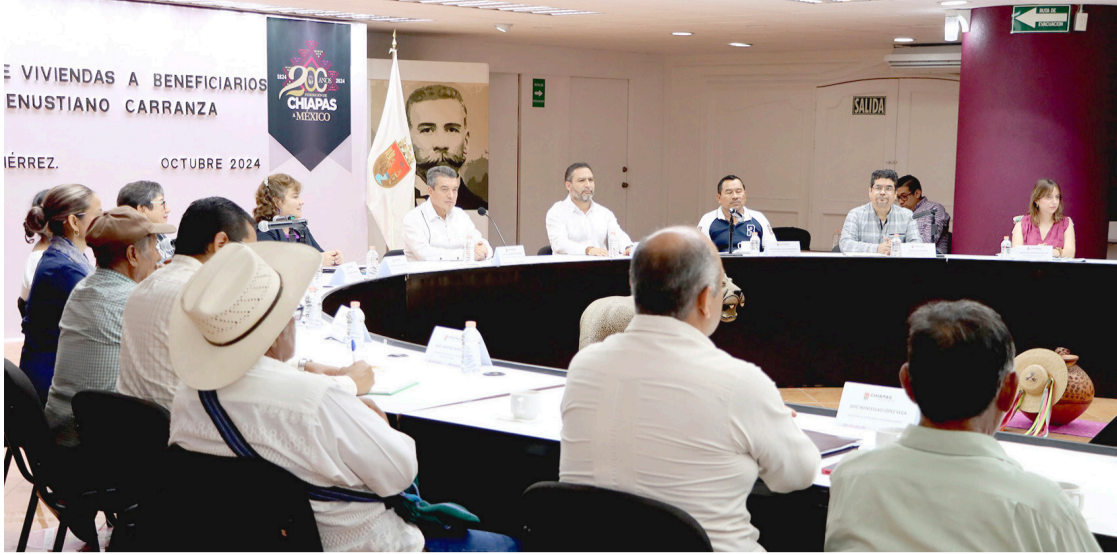
GARANTIZAR UN techo de material, sino que es un símbolo del trabajo a favor de la unión, la dignidad, la justicia y el bienestar de las familias.