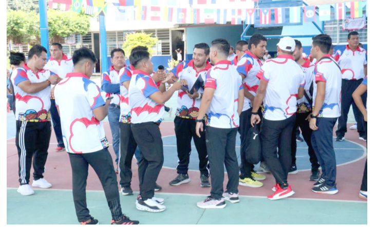
A FIN de fomentar la mejora en la enseñanza y aprendizaje de la educación física.