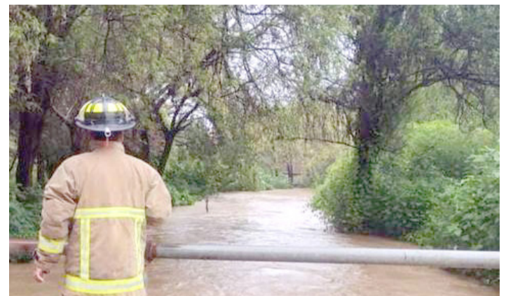
EXPERTOS LLAMAN a la acción en Chiapas ante el cambio climático.

“Con este ecotaxi mi familia tendrá un sustento económico, algo que nos cambiará la vida”, afirmó.