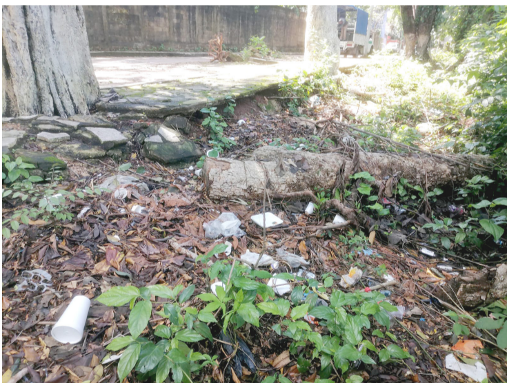
SE PUDO constatar que algunas personas no respetan el horario para tirar basura.