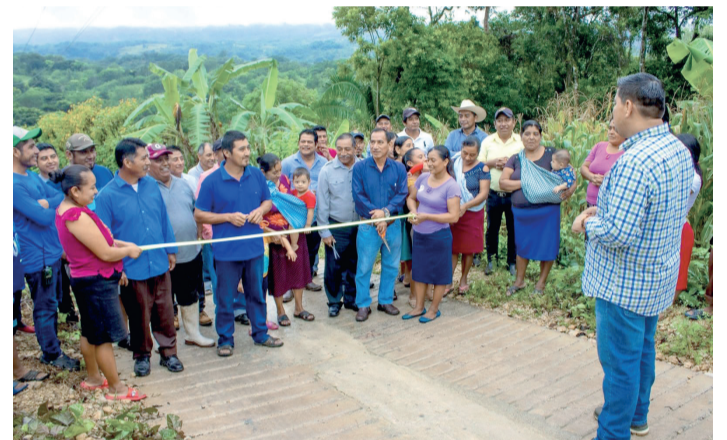
HUELLAS VEHICULARES en tramos aislados de camino que comprenden de los ejidos El Campito-Ubilio García.

al momento de apoyar. Personal de Protección Civil Municipal señaló que la recepción de víveres es de 9 de la mañana a dos de la tarde y también están recepcionando en las instalaciones de PC.