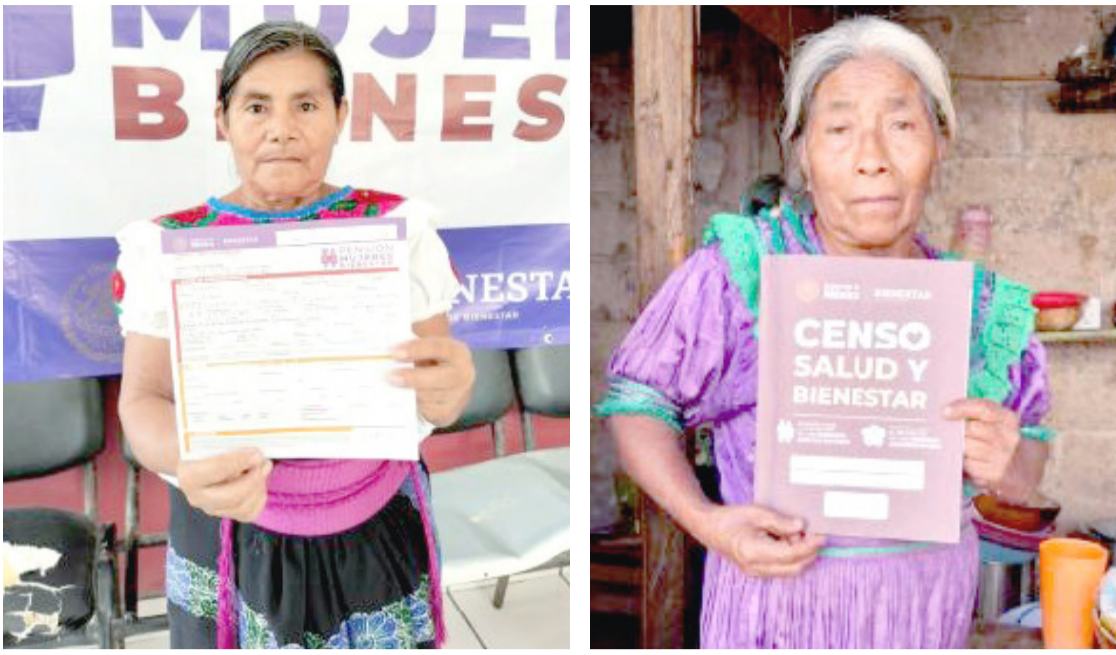
SERVIDORES DE la nación han visitado 41,792 personas adultas mayores y con discapacidad