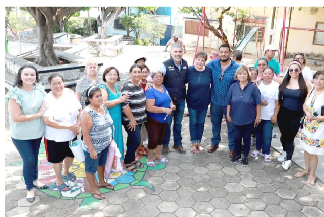
HOY LLEGA la justicia social después de más de 20 años de espera, comentaron las y los vecinos.

En este marco, el alcalde explicó que la rehabilitación consistió en pintura, desmonte, limpieza y reparación de juegos infantiles, entre otras acciones, que las y los vecinos solicitaron desde hace mu-