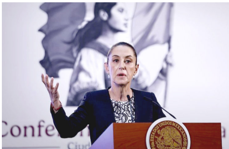
PROYECTO QUE promete mejorar la conectividad y el desarrollo económico en la región.

Este proyecto de carretera, sumado a otros desarrollos como el aeropuerto de Tamaulipas y la construcción de una vía adi-