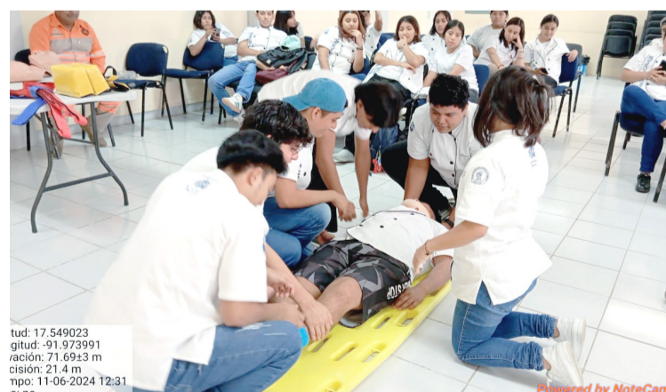
SE BUSCA que los alumnos cuenten con experiencia y conocimientos en cómo actuar en primeros auxilios.

Armendáriz Aquino dio a conocer que brigadistas de Protección Civil acudieron a las instalaciones de la UNICACH, ubicado en Carretera Palenque-La Libertad en donde se brindó capacitación de primeros auxilios y uso y manejo de extintores a alumnos del primer semestre de la carrera