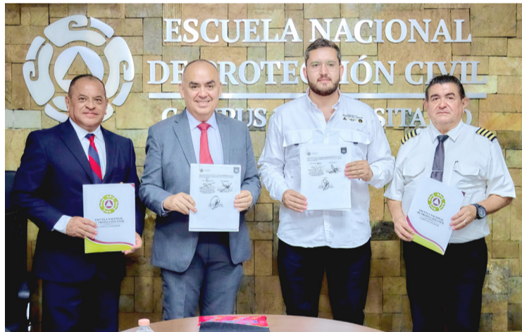
ENAPROC CELEBRÓ un convenio de colaboración académica y tecnológica con Aerospace.