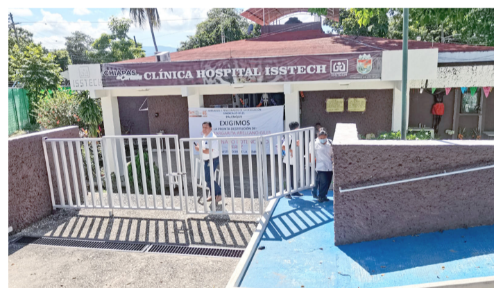
EL PRÓXIMO lunes estará una comisión para darle solución a una parte del pliego petitorio.

2024", el encuentro sobre ruedas se realizará en el Skatepark de la unidad deportiva los días 12 y 13 de noviembre, a partir de las 5:00 p.m. entrada libre.