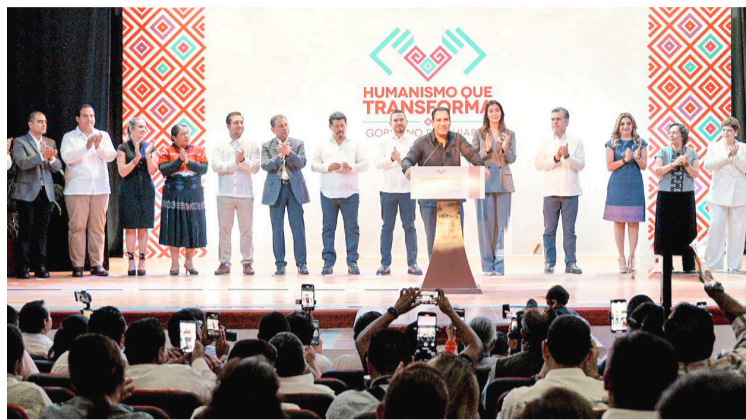
YO NO quiero pasar a la historia, yo quiero escribir la historia: ERA.

•El gobernador electo reitera su llamado a trabajar con humanismo, lealtad y transparencia en beneficio del pueblo de Chiapas