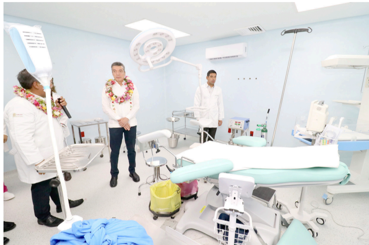
EN TECPATÁN se han invertido más de 350 mdp en obras y acciones para contribuir al progreso y al bienestar de las y los habitantes.

•El gobernador dijo que cuenta con espacios y equipamiento moderno, medicinas e insumos y la atención únicamente de mujeres, a fin de cuidar la intimidad de las pacientes