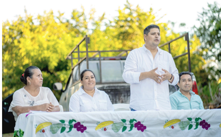
OBRA CON una inversión de 366 mil 271 pesos con 47 centavos.