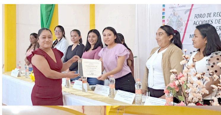
DURANTE ESTAS capacitaciones, las mujeres adquirieron habilidades en la preparación de postres y comidas.

Durante estas capacitaciones, las mujeres adquirieron habilidades en la preparación de postres y comidas, lo cual contribuirá a su bienestar y autonomía económica. Como cierre del foro, las participantes compartieron los postres que prepararon, demostrando lo aprendido en los cursos y disfrutando en