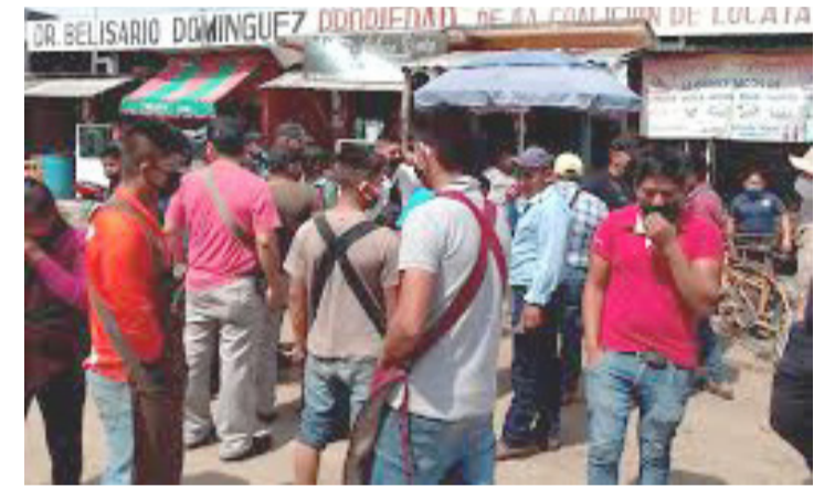
UNA CIUDAD ordenada es responsabilidad de todos los ocosingueses.

y por supuesto que vamos a entrarle al desorden del mercado, he instruido para que se inicien con los procedimientos de los que han construido o tienen objetos sobre las banquetas; vamos a dialogar con los liderazgos, que estén en la disposición de construir acuerdos y pongamos alternativas de solución viable a este añejo tema que, en los últimos tres años se descontroló totalmente y existe riesgo latente para las y los ciudadanos en esa zona; los líderes que se resistan y que no abonen a encontrarle una solución a la problemática, no nos quedará otro camino que aplicar la ley, no podemos ser rehenes de nadie, he solicitado el apoyo de los tres niveles de gobierno para que nos apoyen en este flagelo problema y tenemos respuesta positiva, lo haremos cumpliendo los tiempos y procedimientos que establecen las leyes”.