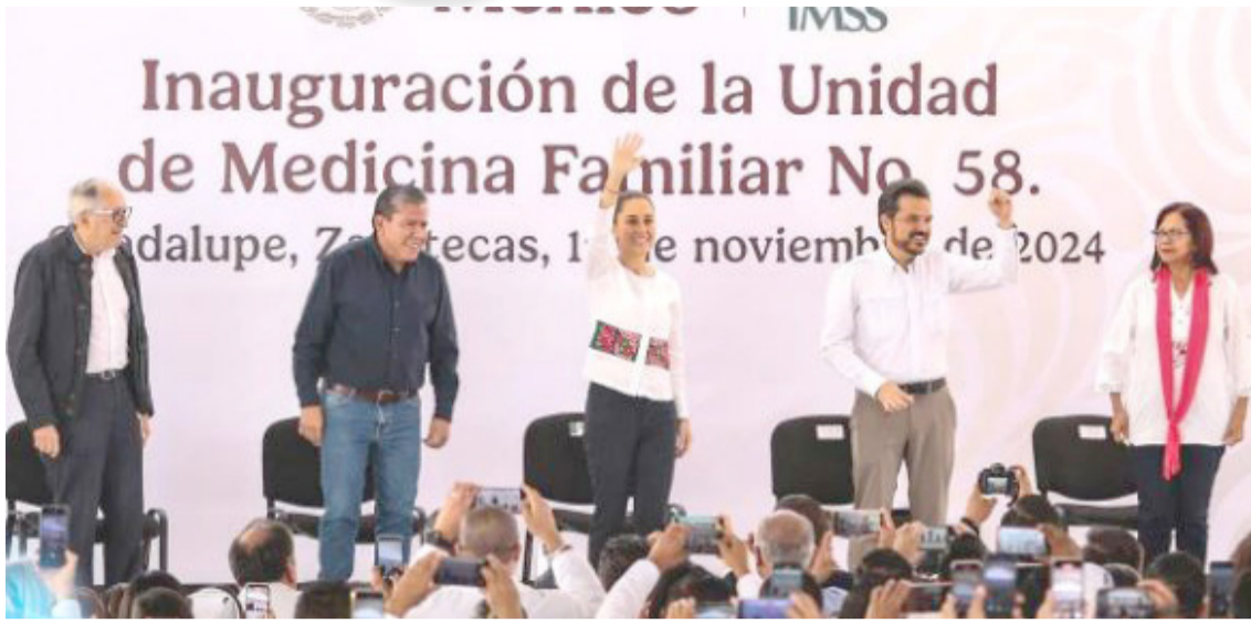
TAMBIÉN ANUNCIÓ la construcción del primer hospital de tercer nivel y la afiliación universal al Sistema Nacional de Salud Pública.