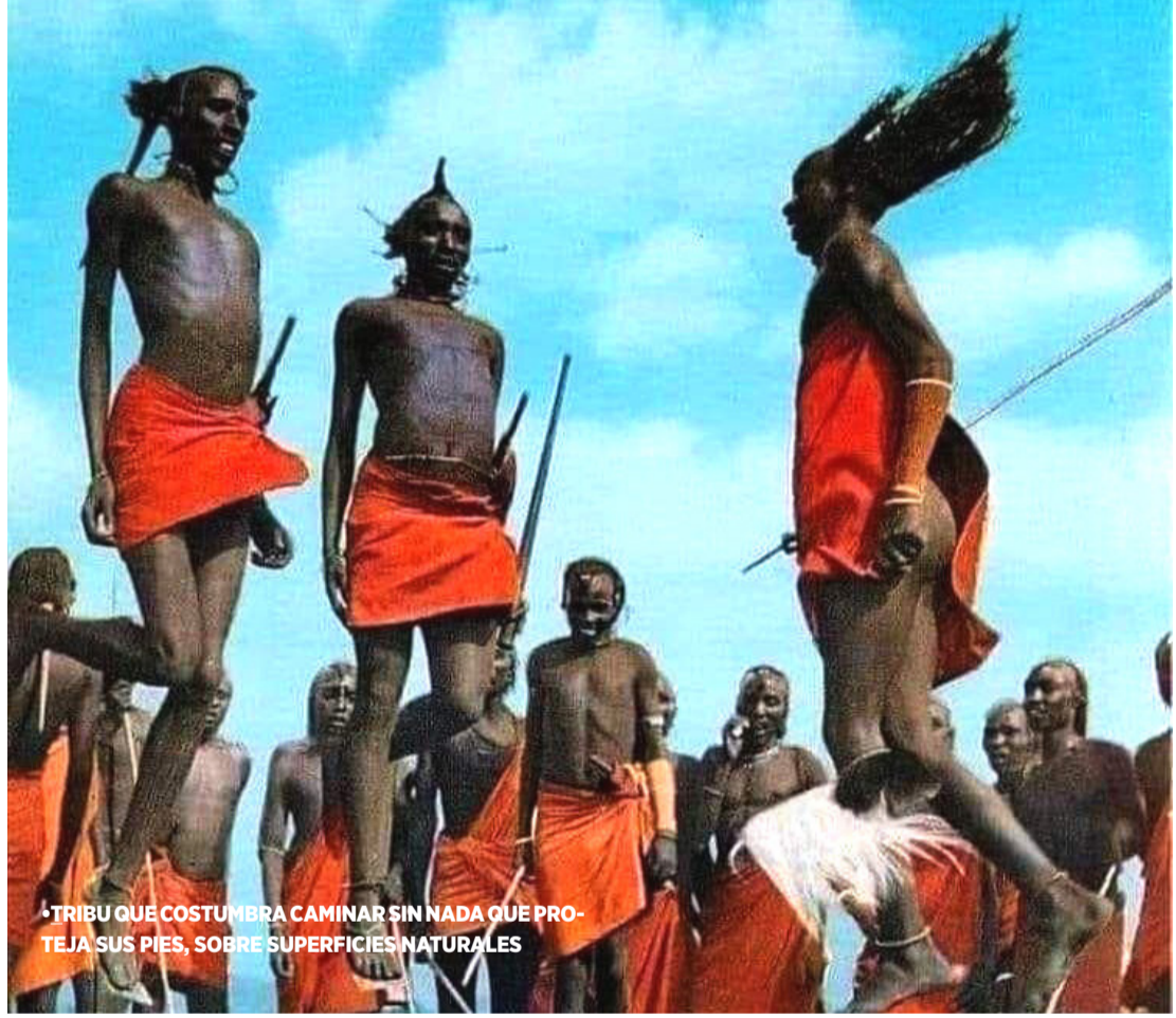
*TRIBU QUE COSTUMBRA CAMINAR SIN NADA QUE PROTEJA SUS PIES, SOBRE SUPERFICIES NATURALES