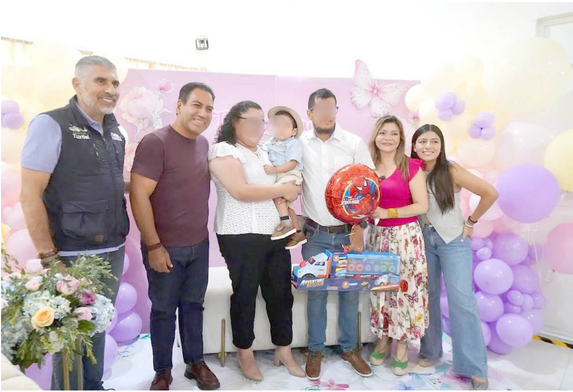
EL MANDATARIO reiteró que se trabaja para garantizarles a las chiapanecas, servicios de salud, seguridad y autonomía económica.