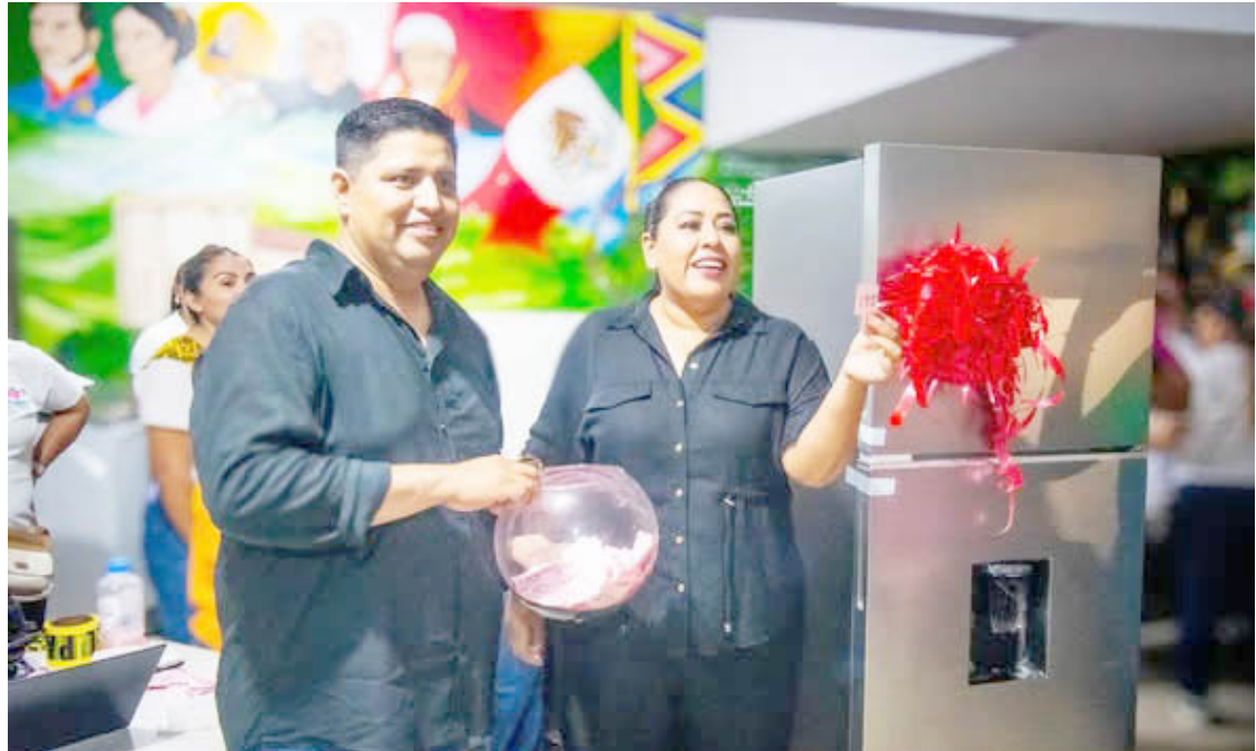
DURANTE LA celebración, se llevaron a cabo rifas con diversos obsequios, regalos y música en vivo.