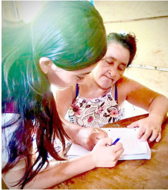
EL PLANTEL CECyT 13 Raudales Malpaso se suma con entusiasmo al movimiento por la alfabetización en el estado.

Las autoridades agradecieron a todos los que forman parte activa de esta iniciativa, reafirmando que con voluntad, empatía y trabajo conjunto, Chiapas sí puede.