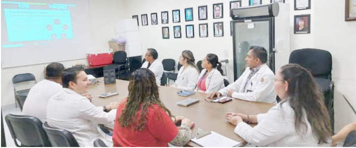
LA SECRETARÍA de Salud del estado impulsa buenas prácticas sanitarias sobre higiene de manos

Este tipo de jornadas reflejan el compromiso del sector salud con el bienestar de la población y con los estándares nacionales e internacionales de calidad en la atención médica.