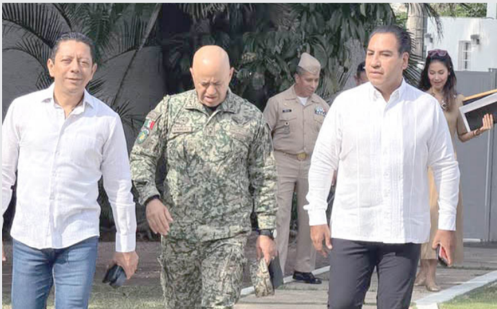
EL FISCAL destacó la urgencia de actuar con firmeza frente a esta problemática que continúa afectando a mujeres y niñas en distintas regiones del estado.

Con este encuentro, las autoridades reafirman su compromiso de no permitir impunidad y de seguir impulsando políticas públicas con perspectiva de género y enfoque preventivo.