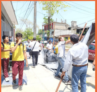
LOS MÁS de mil alumnos regresan a las aulas este martes.