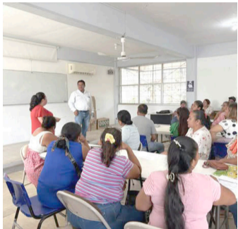
LA JURISDICCIÓN Sanitaria VI Palenque capacita a personal en manejo higiénico de alimentos y saneamiento básico.

Estas acciones forman parte de una estrategia permanente de promoción de la salud, orientada