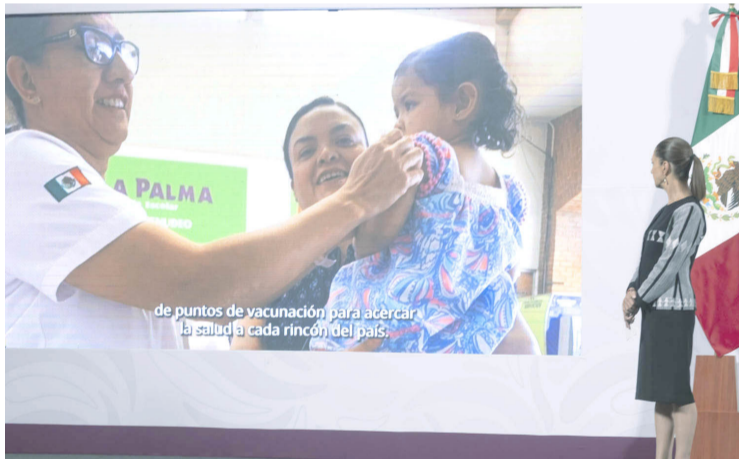
AUNQUE LA Semana Nacional de Vacunación concluyó, las acciones de inmunización continúan de manera permanente en todo México.

Sinaloa fue el estado en el que más vacunas se aplicaron, superando en 340% la meta, seguido de Campeche, con 252%