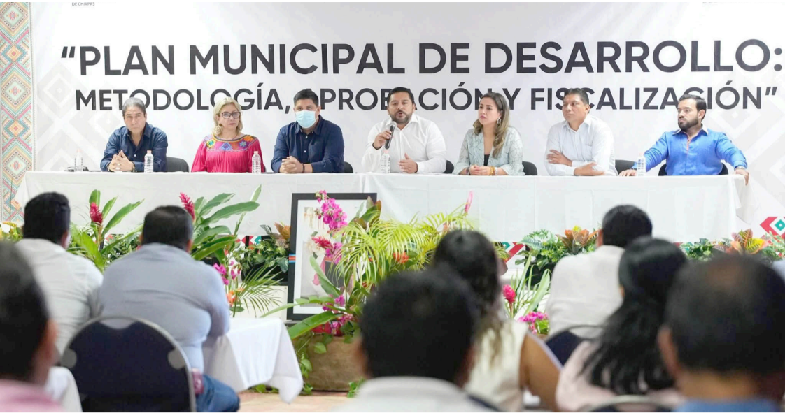
LA META es que los 124 municipios de Chiapas entreguen su Plan de Desarrollo Municipal con orden, visión y apego a la ley.