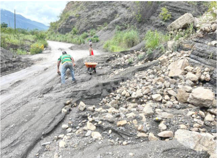
HABITANTES REPORTAN caída de rocas, árboles y lodo que obstruyen la vía; piden a conductores extremar precauciones ante el riesgo de nuevos derrumbes.