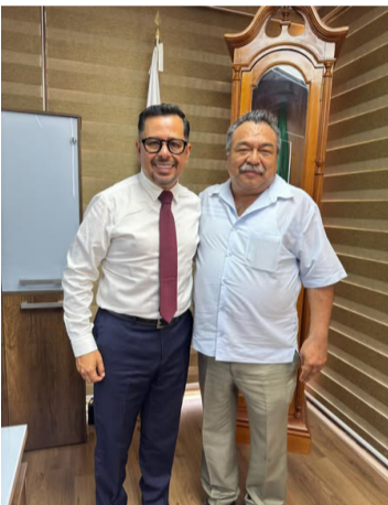
COMOPARTE de esta visita, el edil logró establecer acuerdos e intercambiar ideas con figuras relevantes en el estado.

toridades reafirman su compromiso de no permitir impunidad y de seguir impulsando políticas públicas con perspectiva de género y enfoque preventivo.