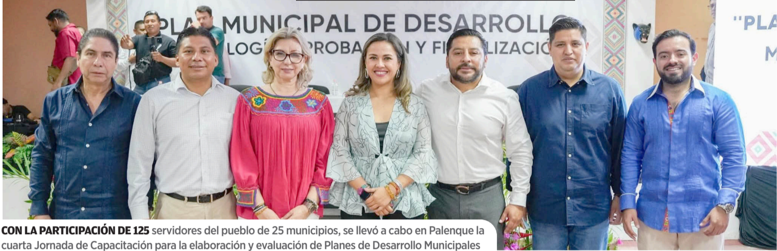
CON LA PARTICIPACIÓN DE 125 servidores del pueblo de 25 municipios, se llevó a cabo en Palenque la cuarta Jornada de Capacitación para la elaboración y evaluación de Planes de Desarrollo Municipales

Miércoles 14 de Mayo de 2026 Núm. 5512 LA VOZ DEL SURESTE Diario de Palenque DiariodePalenqueOficial Año 17 $10.00