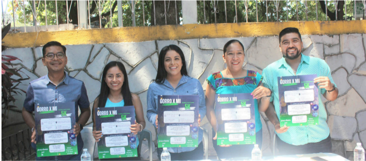
“CORRO POR MÍ” se llevará a cabo el próximo 8 de junio a las 7:00 de la mañana en el poblado Miguel Hidalgo Estación Lacandón.