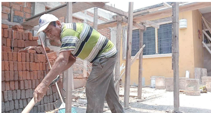
EL GOBERNADOR anunció que los trabajadores de la construcción recibirán un aumento salarial del 37 %.

El mandatario explicó que este aumento es resultado de un acuerdo conjunto con el sector privado y la industria de la construcción, como parte de un esfuerzo por dignificar el trabajo de quienes construyen infraestructura básica como carreteras, viviendas y escuelas en las 15 regiones del estado.