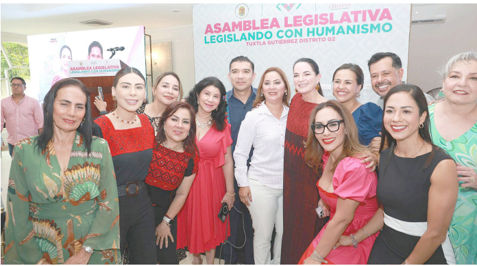
LA DIPUTADA María Mandiola, presentó al pueblo de Chiapas avances y logros de la LXIX Legislatura.

Mandiola compartió, con emoción, la iniciativa que puede marcar una gran diferencia para Chiapas: la creación de la Comisión Especial de Zonas Metropolitanas, “que son motor de la economía y la generación de empleos. Porque necesitamos un plan de trabajo claro, puntual, que oriente el desarrollo en beneficio de la gente. La comisión ayudará a aterrizar más recursos para proyectos estratégicos, dará seguimiento a programas y políticas públicas que hoy requieren atención especializada y permanente. Alentará la cooperación y suma de esfuerzos entre municipios, órdenes de gobierno, y la sociedad”.