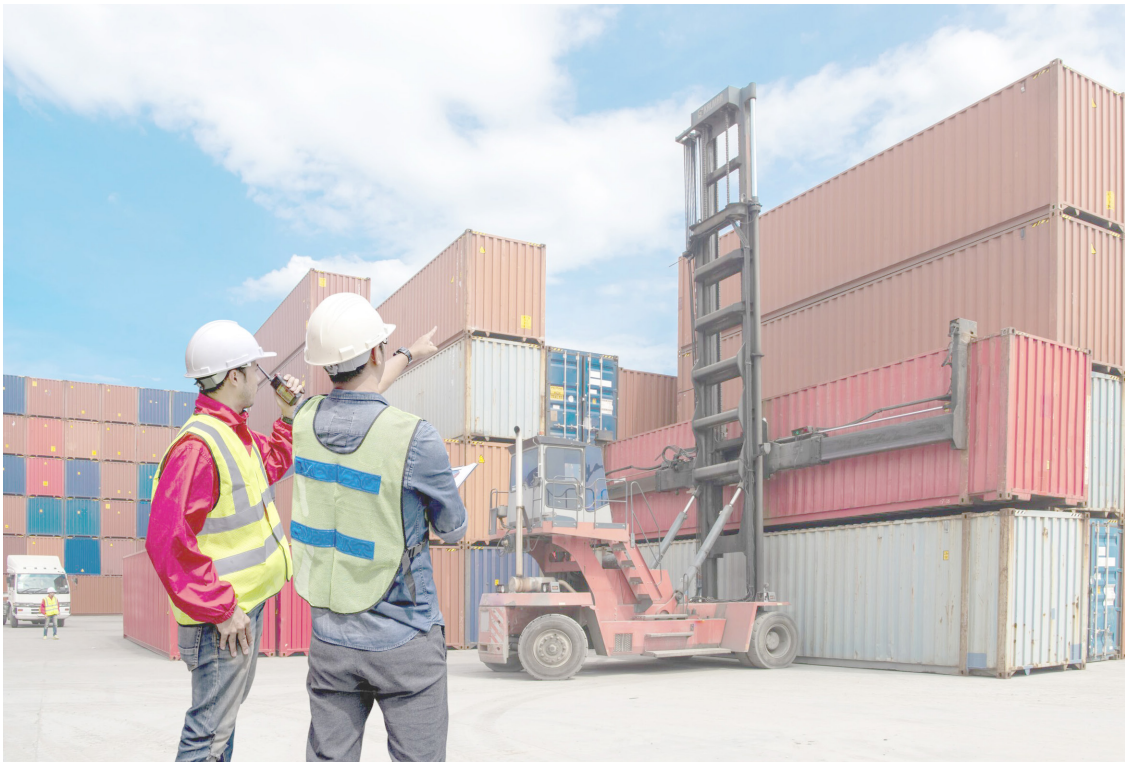
ESTA DECISIÓN estratégica, señaló el mandatario, fortalecerá la dinámica comercial y logística de la región