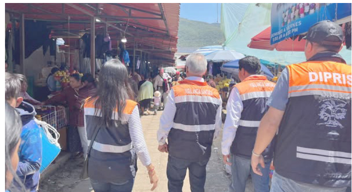
LA VENTA sin conocimiento adecuado de las especies puede poner en peligro la salud de los consumidores.