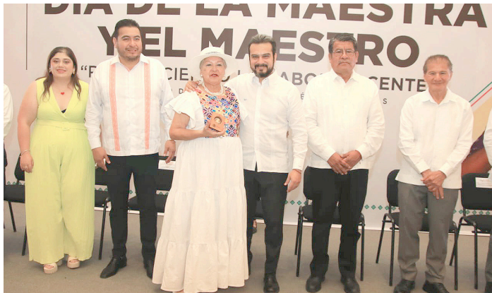
UN TOTAL de 60 docentes fueron reconocidos por su trayectoria de 30, 40 y hasta 50 años de servicio.