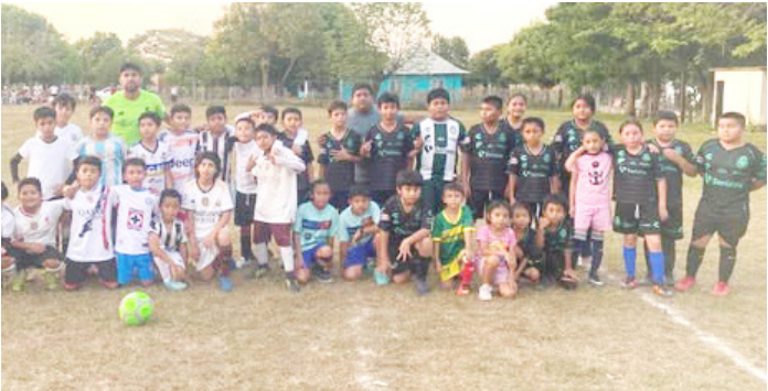
SELECCIÓN DE Palenque categoría 2014-2015 disputó juego amistoso la selección de la comunidad Estación Lacandón.

La Secretaría de la Juventud reafirmó su compromiso de seguir impulsando este tipo de actividades que no solo promueven la recreación y el ejercicio físico, sino que fortalecen el tejido social y el sentido de identidad comunitaria en todo el municipio.