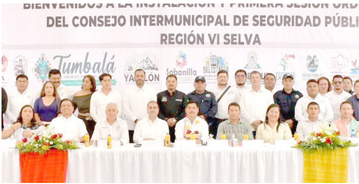
LA PARTICIPACIÓN activa de Chilón en este consejo refleja el compromiso del gobierno municipal con la construcción de un entorno seguro y en paz para sus habitantes.

una cultura de paz, cimentada en la cooperación, la fraternidad y el compromiso social. La sesión del consejo representa un paso más hacia una seguridad más eficiente y humana en la Región Selva, mediante acuerdos concretos, intercambio de información y mecanismos de actuación conjunta entre municipios.