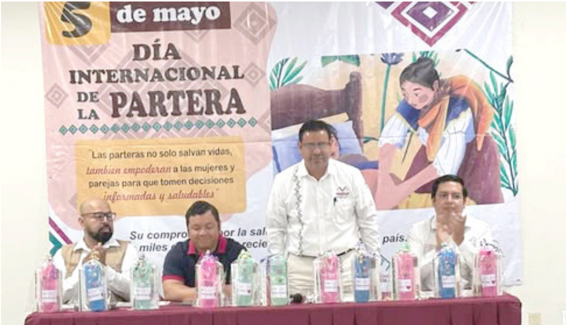
CAPACITACIÓN Y entrega de kits marcan la conmemoración del Día Internacional de las Parteras y la Salud Materna y Perinatal.