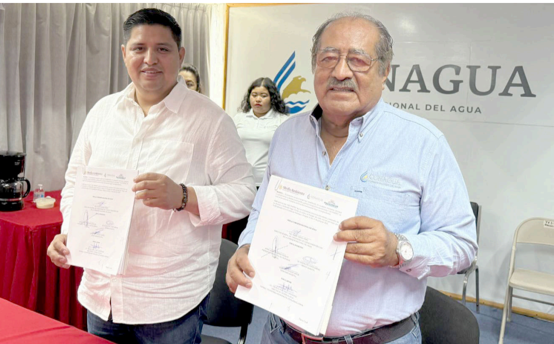
FIRMAN CONVENIO para plan maestro de drenaje y saneamiento en Palenque, lo que dará paso a una planta de tratamiento de aguas residuales.