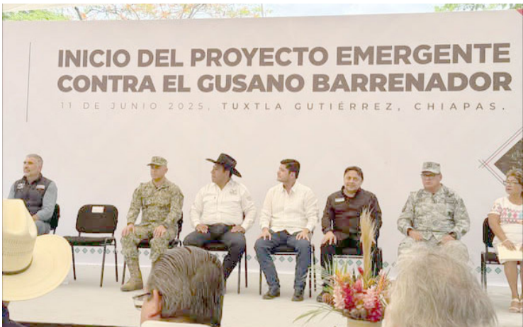
PALENQUE PARTICIPA en arranque del Proyecto Emergente contra el Gusano Barrenador

Con la puesta en marcha de este programa, el Gobierno del Estado, en coordinación con autoridades municipales y federales, busca fortalecer la sani-