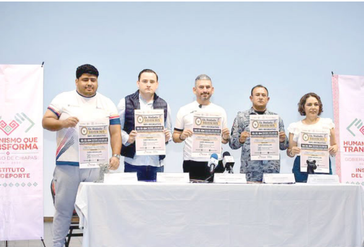
SE ESPERA la participación de 3 mil participantes en ambas ramas, dentro de la categoría Libre en las distancias de 10 y 15 kilómetros.

El arranque de la justa recreativa será a las 07:30 horas desde el Parque de La Juventud