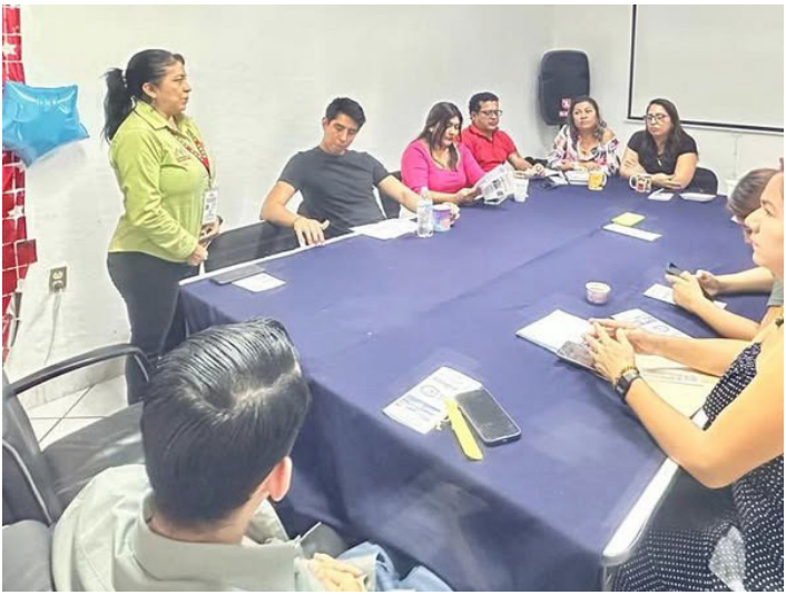
EL PROYECTO de Robótica y STEAM colabora con el Banco de Sangre para sensibilizar a personal educativo sobre la donación altruista.