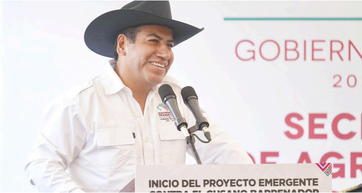
CHIAPAS REFUERZA lucha contra el gusano barrenador con entrega de kits a ganaderos.

El proyecto, desarrollado en coordinación con instituciones federales y estatales, incluye la distribución gratuita de insumos veterinarios, capacitación técnica y seguimiento especializado en campo. Se prevé que este esfuerzo conjunto for-