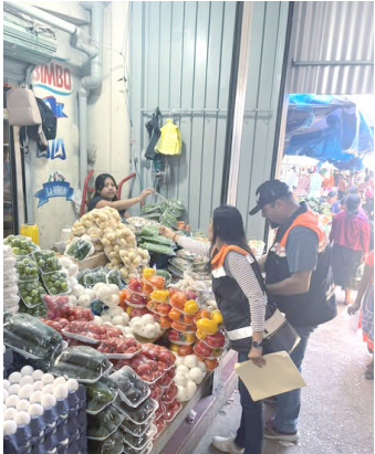
LA SECRETARÍA de Salud exhorta a la población a evitar ingerir hongos de origen desconocido por riesgo de intoxicación.

Durante la temporada de lluvias, es común que en distintas regiones del estado proliferen hongos silvestres que se venden en mercados o se recolectan en zonas rurales; sin embargo, no todos son seguros para el consumo humano.