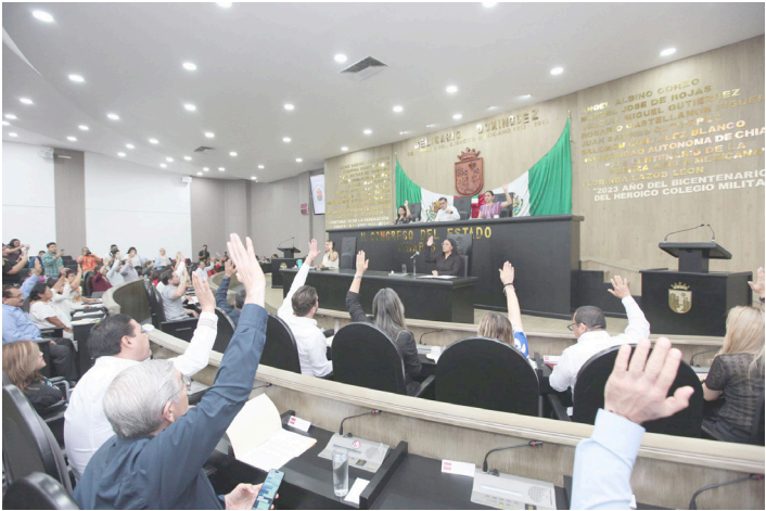
DICHA REFORMA de ley, contempla como materia optativa, la educación ambiental en el sistema educativo de Chiapas.

Así también, se dio lectura y se turnó a comisiones parlamentarias -para su estudio y dictamen- el oficio signado por la Secretaría General de Gobierno y Mediación, por medio del cual remite a esta soberanía popular iniciativa de decreto por el que se reforman, adicionan y derogan diversas disposiciones de la Ley que establece las Bases de Operación de la Secretaría de Seguridad del Pueblo del estado de Chiapas y la Ley del Sistema Estatal de Seguridad Pública.