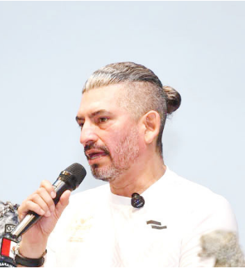
de atención para aquellas personas que busquen participar.

Las inscripciones son gratuitas y podrán realizarse a través del escáner del código QR que se encuentra en la convocatoria, las y los interesados podrán realizar su registro hasta la noche del 14 de junio. El día de la justa habrá módulos