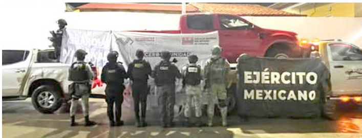
ADEMÁS, SE aseguraron armas, indicios balísticos y vehículos.

Agregaron que en esta Nueva ERA de seguridad se da un paso más hacia una seguridad moderna, eficiente y al servicio del pueblo con cero corrupción.