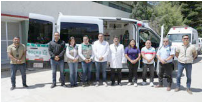
BENEFICIARÁ RECONVERSIÓN a más de 14 municipios y población trabajadora, estudiantil y derechohabiente.

El presidente municipal de Tuxtla Gutiérrez, Angel Torres Culebro, aseguró que, así como se han logrado avances significativos en materia de seguridad, esta iniciativa ambiental también será exitosa gracias a la firme determinación y al compromiso del gobernador Eduardo Ramírez con la protección de los recursos naturales. Reafirmó que el Ayuntamiento se suma a este esfuerzo colectivo en favor del medio ambiente.