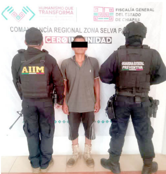
LOS HECHOS ocurrieron en el ejido Agua Blanca Serranía del municipio de Palenque.

El presunto agresor fue puesto a disposición del órgano jurisdiccional, quien definirá su situación legal.