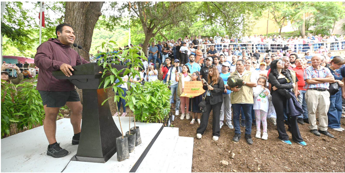
EL MANDATARIO dio inicio a la campaña “Siembra con conciencia” en el MUCH, reafirmando su compromiso con la restauración ambiental y la protección de los recursos naturales en Chiapas.