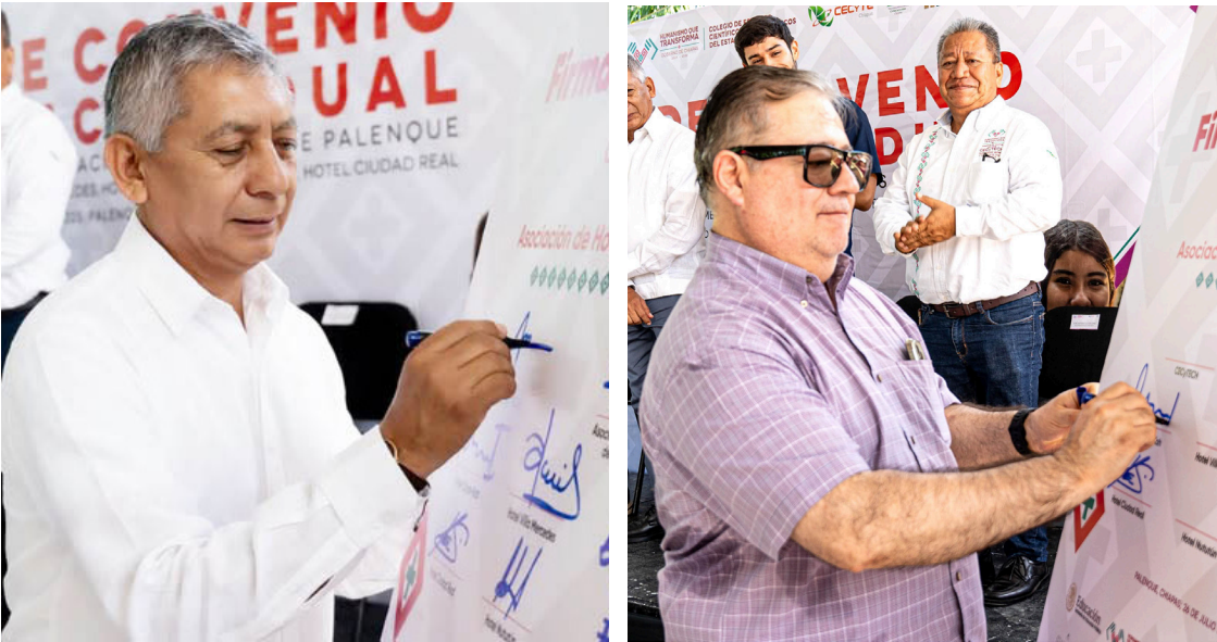
SE DESTACÓ LA IMPORTANCIA de esta alianza para seguir posicionando a Palenque como un destino turístico de excelencia.