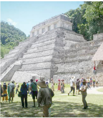
LA ZONA arqueológica continúa atrayendo a cientos de visitantes que recorren y fotografían una de las ciudades mayas más emblemáticas del sureste mexicano.

La zona arqueológica de Palenque, reconocida a nivel mundial por su riqueza histórica y belleza arquitectónica, ha registrado una importante afluencia de turistas nacionales e internacionales en los últimos días, consolidándose como uno de los destinos culturales más visitados del sureste mexicano. Grupos numerosos de visitantes han recorrido los templos, plazas y estructuras de esta antigua ciudad maya, maravillados por su majestuosidad, historia y entorno natural. Muchos han aprovechado para tomar fotografías, escuchar recorridos guiados y vivir la experiencia única de caminar por uno de los sitios prehispánicos más relevantes de Mesoamérica. Autoridades locales celebran este repunte turístico, que refleja el interés sosteni-