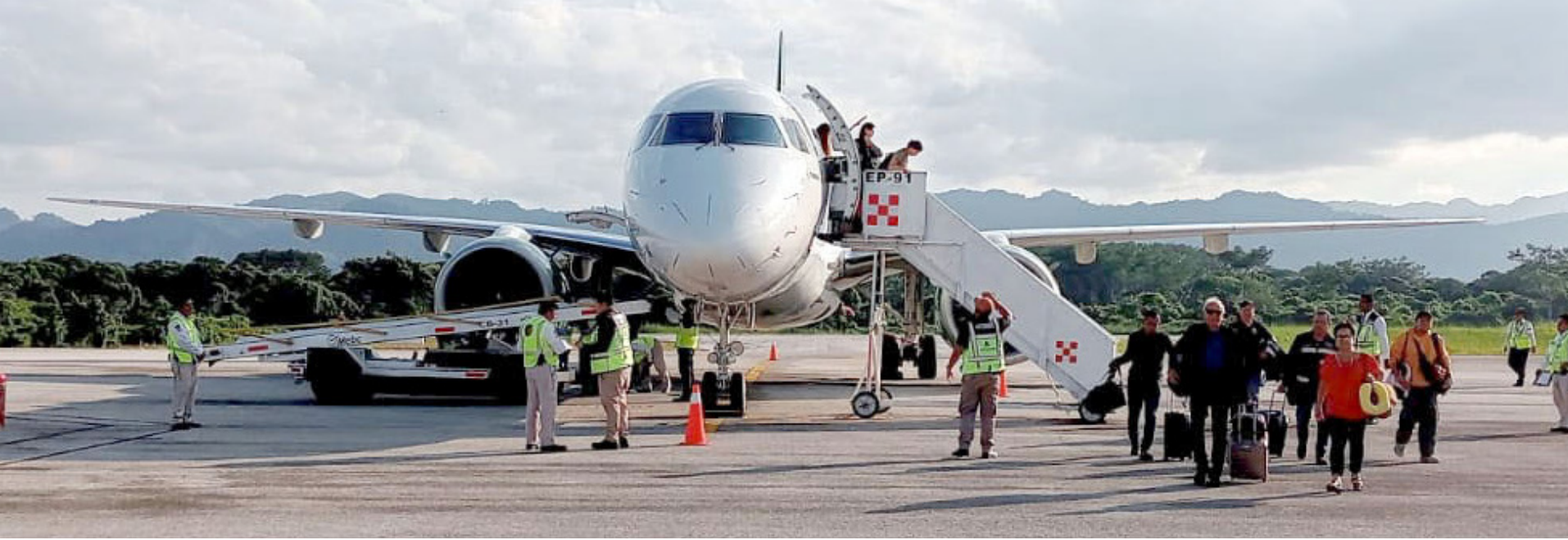
ESTE MODELO se suma a la flotilla que cubrirá diversas rutas nacionales, incluida la conexión entre Palenque y el AIFA.