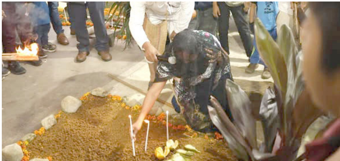
FAMILIAS Y autoridades participaron en una colorida jornada de fe, cultura y convivencia en honor al Día de Muertos.

El 3 de noviembre se celebra el Día Mundial del Sándwich, una de las fechas más sabrosas del calendario y es que el sándwich es uno de los platos más populares y variados que existen a nivel mundial. Muchas franquicias de comida rápida que sirven este plato, han decidido transformar esta festividad en un evento por todo lo alto. Como en el caso de Subway que durante esta jornada recauda dinero para alimentar a personas menos favorecidas.