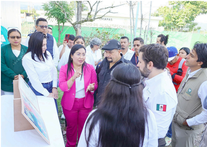
AUTORIDADES FEDERALES , estatales y municipales recorrieron el hospital de 20 camas y dieron seguimiento al proyecto que fortalecerá la atención médica en la región.