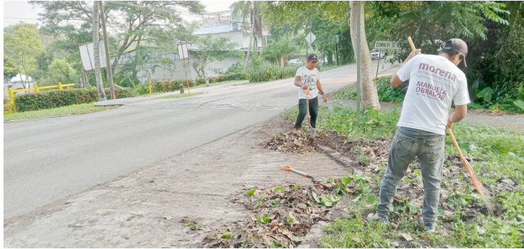
EL AYUNTAMIENTO realiza labores de limpieza y mantenimiento para ofrecer espacios seguros y agradables a la ciudadanía y visitantes.

Con estas labores, el Ayuntamiento reafirma su compromiso