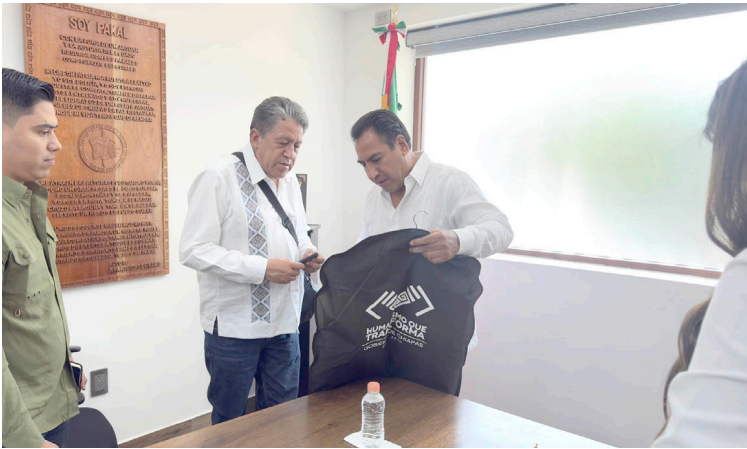
EL MANDATARIO destacó la coordinación con el gobierno de Claudia Sheinbaum, que fortalece la atención a familias chiapanecas que requieren vivienda digna.