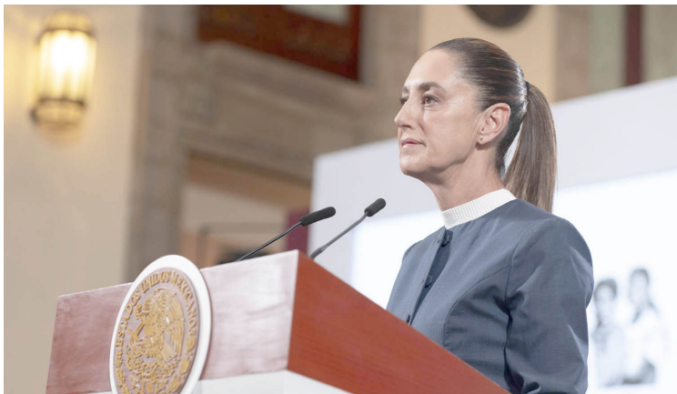
LA MANDATARIA destacó que los resultados reflejan el fortalecimiento del mercado laboral y la confianza en la economía nacional.

Asimismo, destacó que en los últimos doce meses se han sumado 20 mil 108 puestos, lo que corresponde a una tasa anual del 0.1 por ciento. Aunque el incremento interanual es moderado, el comportamiento del empleo mantiene una tendencia sólida