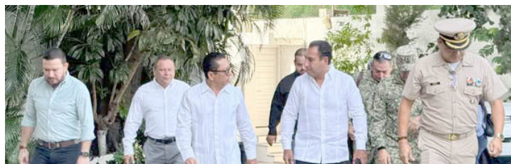
AUTORIDADES ESTATALES reconocen la responsabilidad ciudadana y el trabajo conjunto entre los tres órdenes de gobierno.