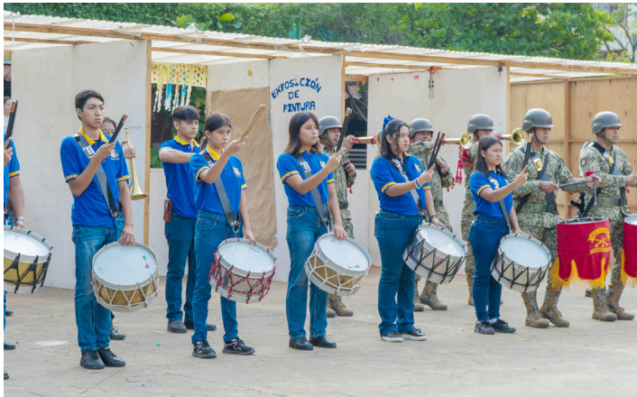
AUTORIDADES MUNICIPALES, estudiantes y ciudadanía participaron en la ceremonia cívica del primer lunes de mes.

Con estas ceremonias, el Ayuntamiento de Palenque refuerza su compromiso de cultivar la identidad nacional y la educación cívica, recordando la importancia de mantener vivos los símbolos y tradiciones que representan a México.