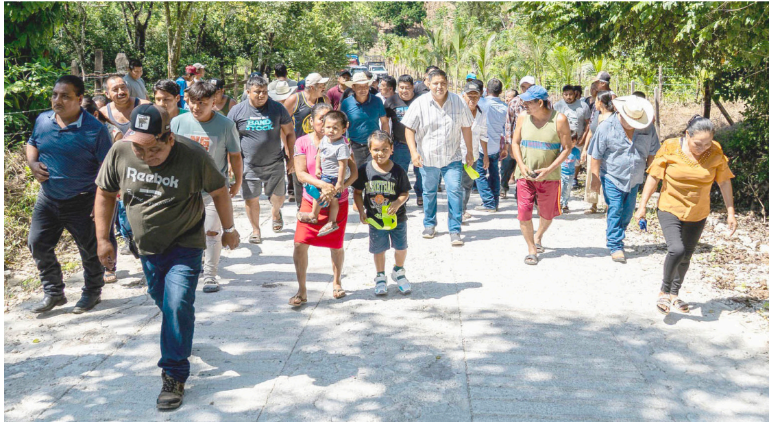
CON UNA inversión de más de 865 mil pesos, el Ayuntamiento modernizó el camino con huellas de concreto y zampeado de piedra.