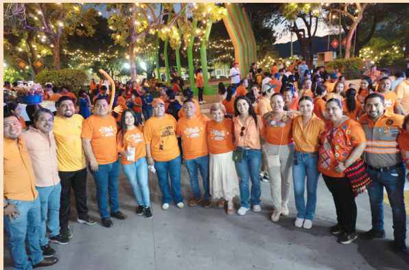
ESTA CAMINATA partió desde las afueras del Hospital General y culminó en el Palacio Municipal de esta ciudad.

En el marco de la Conmemoración del Día Internacional de la Eliminación de la Violencia contra la Mujer, el H. Ayuntamiento Municipal de Palenque, a través de la Dirección de Prevención del Delito y la Instancia Municipal de la Mujer, en coordinación con y las Jornadas por la Paz que impulsa la Mesa de Seguridad, llevó a cabo una “Caminata contra la Violencia”, como símbolo de protesta pacífica para la erradicación de la violencia contra las mujeres. Esta caminata partió desde las afueras del