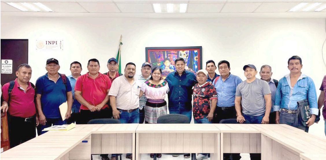
EL DIÁLOGO y la coordinación buscan garantizar bienestar, identidad y respeto a los usos y costumbres de las comunidades de Palenque.