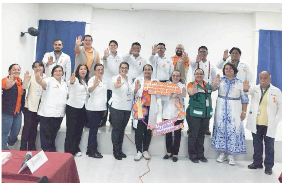
LA JURISDICCIÓN Sanitaria VI implementa acciones de sensibilización para prevenir la violencia contra las mujeres.

Durante las jornadas, se realizaron pláticas informativas y dinámicas educativas que buscaban orientar a la comunidad sobre cómo identificar, prevenir y denunciar situaciones de violencia de género. Asimismo, se compartieron recursos y líneas de apoyo para mujeres que puedan estar