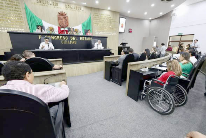
EL CONGRESO de Chiapas fortalece la protección a víctimas y homologa el marco jurídico con la legislación federal.