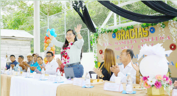
LA PRESIDENTA municipal entregó la obra que reforzará la seguridad de estudiantes en el Ejido Río Blanco San Vicente.

Durante el acto, la alcaldesa destacó que esta mejora forma parte del compromiso de su administración por brindar espacios dignos y seguros que contribuyan al aprendizaje y