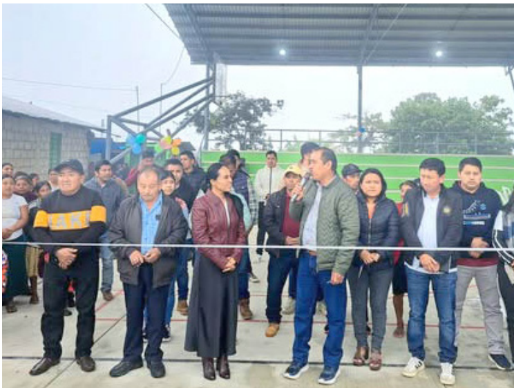
LA OBRA beneficiará a niñas, niños, jóvenes y familias del Barrio San Cristóbal y zonas aledañas.

La obra fue recibida con entusiasmo por las y los vecinos,