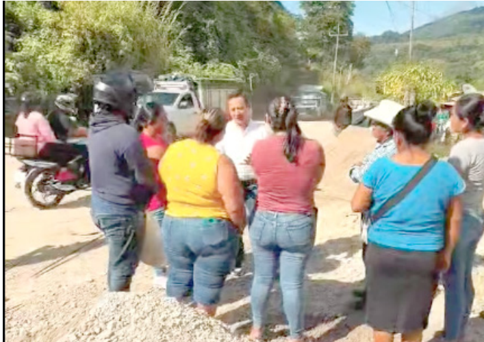
EL ALCALDE de Yajalón constató los avances de la nueva casa de salud que beneficiará a familias de la localidad La Laguna.

Con esta sesión, el municipio de Tila fortalece su estrategia de seguridad y reafirma la coordinación institucional como eje principal para preservar la paz y el orden en la región