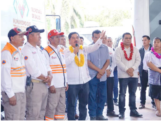
ES LA primera ocasión que este programa de atención médica gratuita llega hasta esta comunidad del municipio de Chilón.

Estas acciones forman parte del esfuerzo integral impulsado por la Secretaría de Salud de Chiapas, bajo