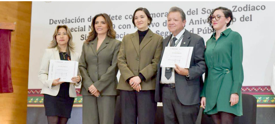
AUTORIDADES DESTACARON la importancia del SNSP dentro de la Estrategia Nacional de Seguridad Pública.

Con estas acciones, el Gobierno del Estado reafirma su compromiso tanto con el medio ambiente como con la juventud chiapaneca, fortaleciendo políticas que promuevan un desarrollo sostenible y el impulso al talento local.