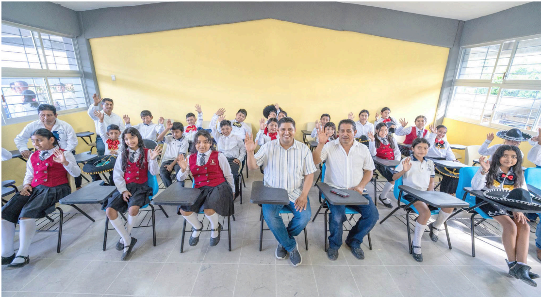
AUTORIDADES Y familias destacaron el compromiso por fortalecer la educación en el municipio.

Refrendamos nuestro compromiso de seguir trabajando por el bienestar de las familias palencanas, impulsando acciones que promuevan la inclusión, la movilidad y el acceso a mejores oportunidades.