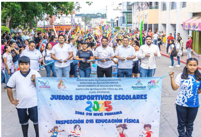
EL EVENTO fomenta la actividad física y valores como disciplina, respeto y trabajo en equipo entre los estudiantes.