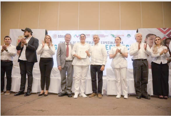
CEREMONIA DE Entrega de 1,300 Títulos de Especialidad a egresadas y egresados del CECyTECH, así como la Presentación del Plan de Acción 2026.

Este acto reconoce y formaliza la culminación de la formación académica y técnica de jóvenes egresados de los planteles 40 Las Águilas, 20 San Cristóbal de Las Casas, 19 Palenque, 10 Simojovel y 06 Acapetahua, quienes hoy cuentan con un título que respalda su preparación como recurso humano calificado para