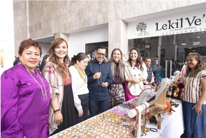
UN EVENTO en el que se mezcla la cultura y las tradiciones de los pueblos originarios.