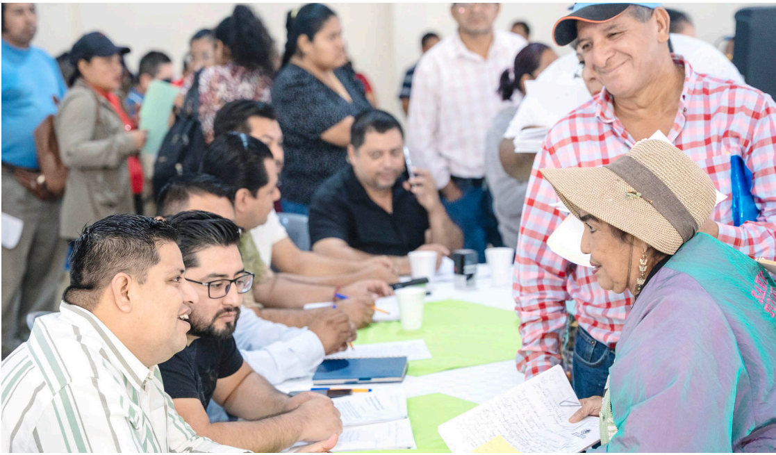
SE BUSCA priorizar proyectos de alto beneficio y garantizar el cumplimiento de la documentación requerida para su ejecución.