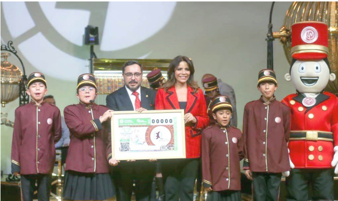
EN EL marco de los 90 años del Instituto Politécnico Nacional (IPN) y para reconocer la contribución que ha hecho desde 1936 al país.

El director general del Politécnico, Arturo Reyes Sandoval, agradeció la distinción que la Lotería Nacional hace a la institución y destacó que con el Sorteo Superior 2868, se inician formalmente los festejos por el 90 aniversario del IPN, una celebración profundamente significativa para la comunidad politécnica, educativa y científica del país.