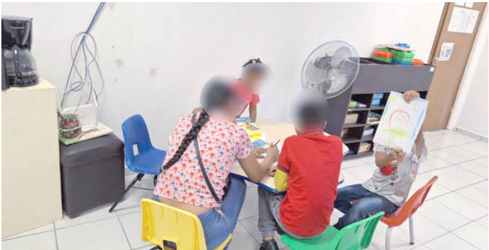
ESTE SERVICIO es totalmente gratuito y se encuentra disponible de lunes a viernes, en un horario de 8:00 a.m. a 4:00 p.m., en las instalaciones del DIF Municipal de Palenque.