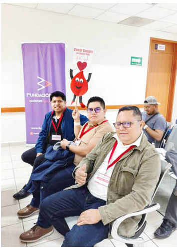
EL CENTRO Estatal de la Transfusión Sanguínea agradeció a la Fundación ADO y a donadores voluntarios por su compromiso con la vida y la solidaridad.

Asimismo, el Centro reconoció y agradeció de manera especial al donador altruista vo-