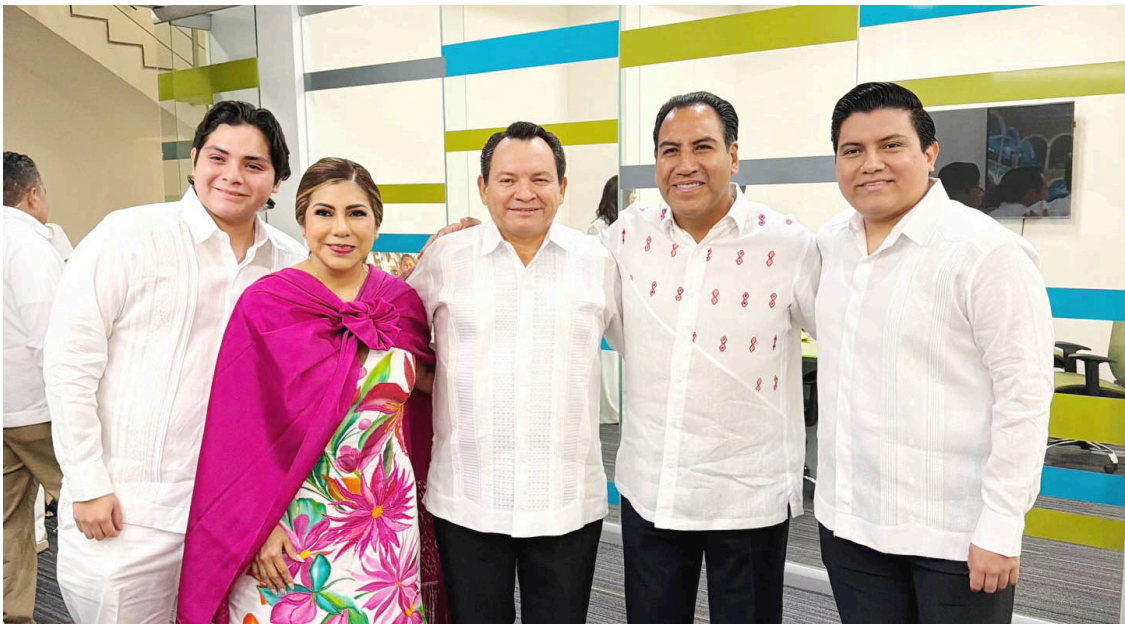
RAMÍREZ AGUILAR reconoció el compromiso y las acciones que generan desarrollo y bienestar durante el primer año de gestión.