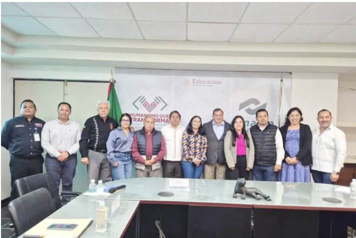
LA SECRETARÍA de Educación fortalece la Educación Media en Chiapas con el enfoque del Lekil Kuxlejal y la Nueva Escuela Mexicana, colocando al estudiantado en el centro.