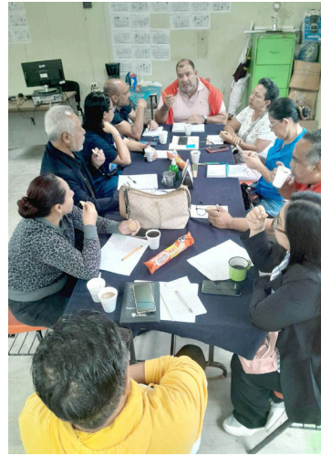
EL CECYT 19 Palenque reunió a los presidentes de academias para coordinar actividades y estrategias en beneficio de sus estudiantes.

Durante el encuentro, se destacó la importancia de la colaboración entre las distintas áreas académicas para garantizar una educación de calidad y el desa-