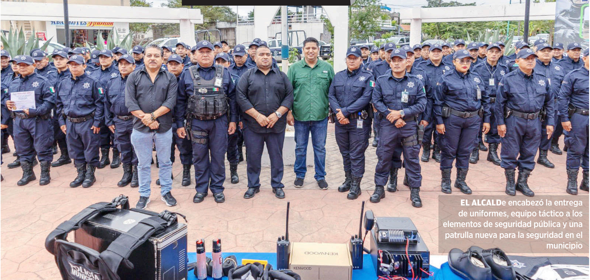
EL ALCALDe encabezó la entrega de uniformes, equipo táctico a los elementos de seguridad pública y una patrulla nueva para la seguridad en el municipio