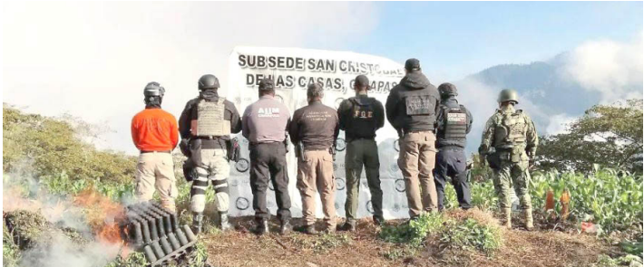
EJÉRCITO MEXICANO y Guardia Nacional localizaron y erradicaron casi 10 mil metros cuadrados de enervantes en la región Altos de Chiapas.