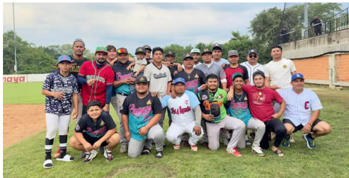
A PESAR del triunfo de los Bravos, la serie se mantiene a favor de los Vaqueros con marcador de 3-1.

Con esta reinstalación, se busca fortalecer la capacidad operativa de las autoridades locales, mejorar la coordinación interinstitucional y garantizar una atención oportuna ante emergencias que puedan afectar a las comunidades y al entorno natural.