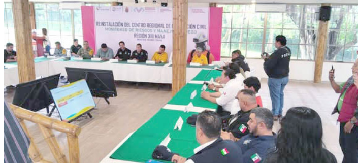
CONANP PARTICIPA en el fortalecimiento de la seguridad y manejo de riesgos en la región Maya.

Con estas acciones, el Gobierno Municipal de Palenque reafirma su compromiso de fortalecer al cuerpo de Seguridad Pública, garantizando mejores condiciones de trabajo a los policías y mayor seguridad para la ciudadanía.