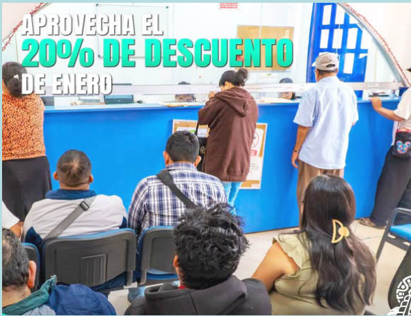
EL AYUNTAMIENTO ofrece beneficios especiales y rifas mensuales para contribuyentes cumplidos.

De igual manera, se informó que los ejidatarios cuentan con estímulos especiales: hasta 10 hectáreas obten-