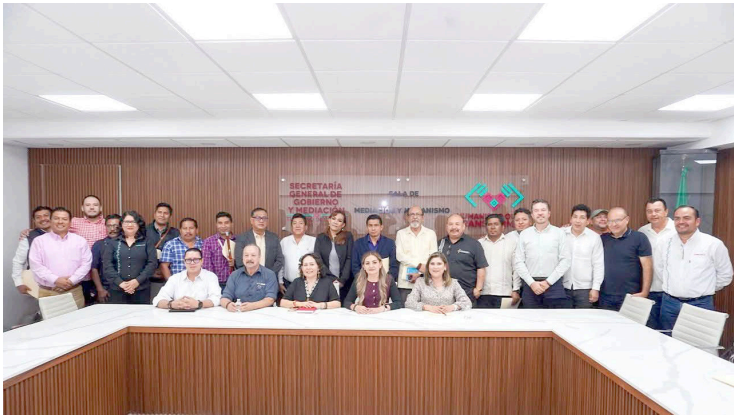
EL SECTOR empresarial se suma a iniciativas culturales que fomentan valores y la integración familiar.

Se subrayó la importancia de la cultura como un eje es-