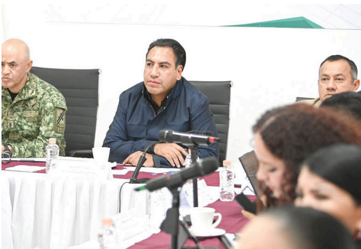
SE INSTALÓ de manera permanente la base KANAN-C6 y fuerzas estatales para garantizar la tranquilidad regional.