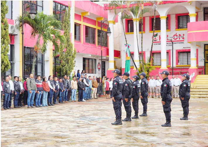
EL AYUNTAMIENTO reiteró su compromiso con una educación basada en valores, disciplina y sentido social.

Con estas acciones, Tila reafirma su compromiso con la cultura y la educación, buscando que todos los ciudadanos tengan oportunidades de aprendizaje, recreación y desarrollo integral en un entorno de colaboración y bienestar social.