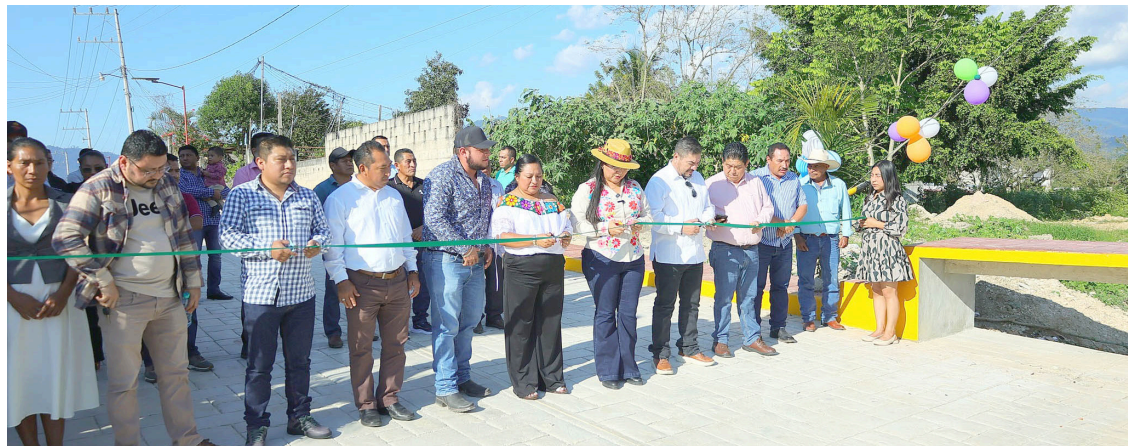
LA OBRA mejora la movilidad y facilita el acceso al Parque Feria durante las festividades de la Virgen de la Candelaria.

Finalmente, las fuerzas federales exhortaron a la población a reportar al número de emergencias 911 cualquier actividad relacionada con la siembra, cosecha o venta de enervantes en Santiago el Pinar y en la región Altos de Chiapas, con el objetivo de prevenir el consumo de drogas y sus afectaciones sociales.