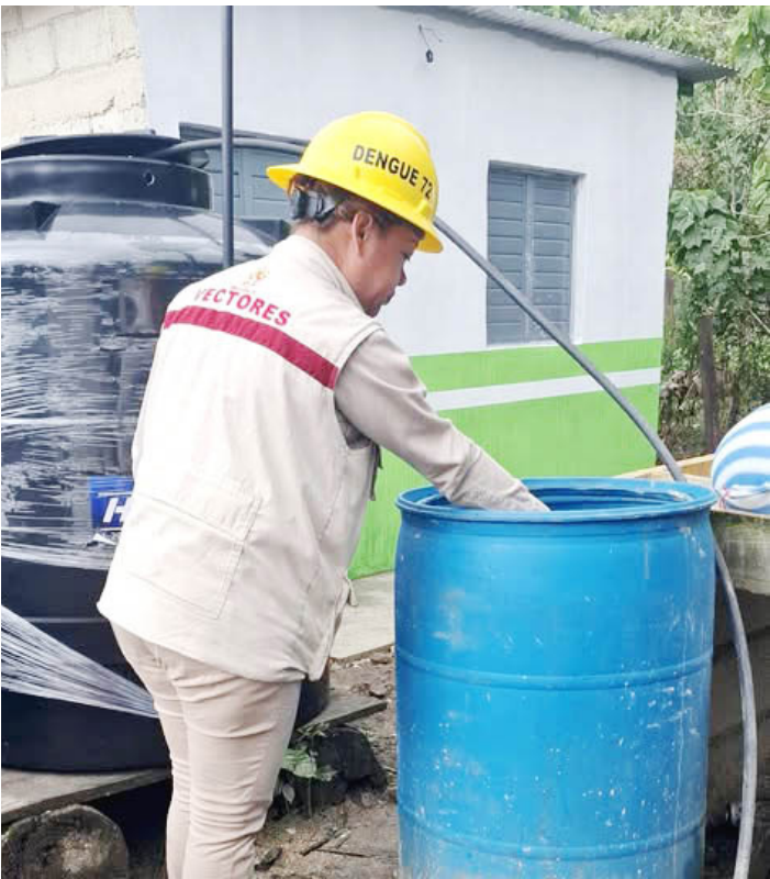
ACCIONES DE control larvario y eliminación de criaderos se realizan en Santa Rita y el barrio 20 de Noviembre.