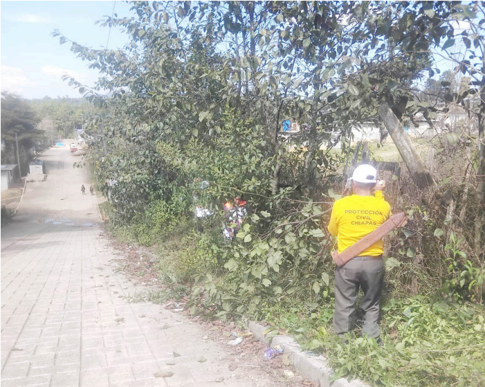
LIMPIEZA DE alcantarillas y mantenimiento vial se realizan en Oxchuc y Chanal para reducir riesgos.