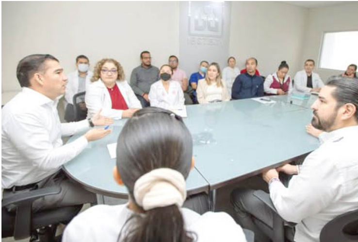
EL DIRECTOR del ISSTECH evaluó avances y reforzó el compromiso con una atención médica digna y de calidad.