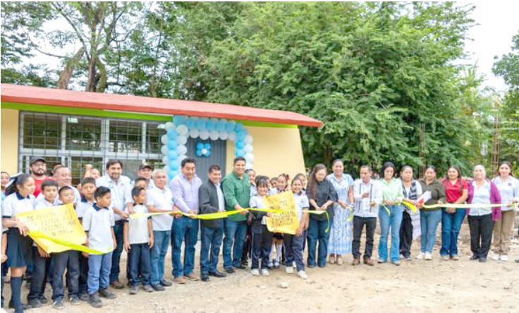
PALENQUE ABRE un nuevo espacio educativo en la Escuela Primaria Bilingüe “Carlos Pellicer Cámara” para fortalecer la educación y la cultura local.