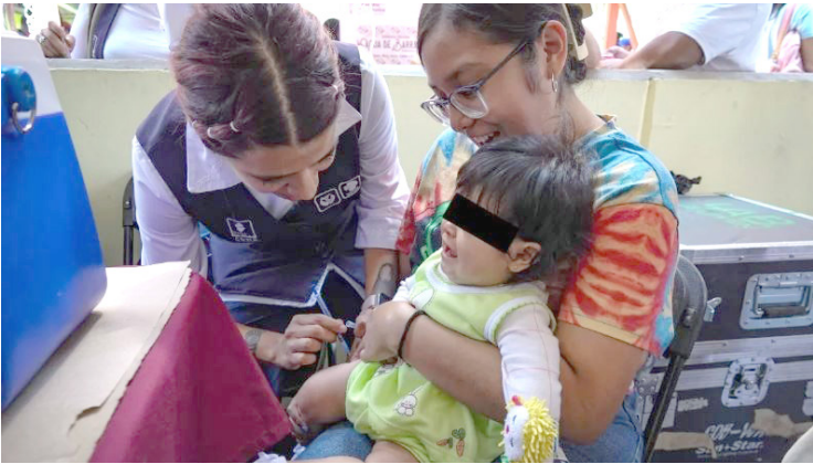
CHIAPAS Y Jalisco concentran la mayor parte de los casos; autoridades refuerzan vacunación y aplican “dosis cero” en menores de seis a once meses.

Jalisco y Chiapas son actualmente los estados con mayor número de casos. La SSA informó además la implementación de una “dosis cero” para niñas y