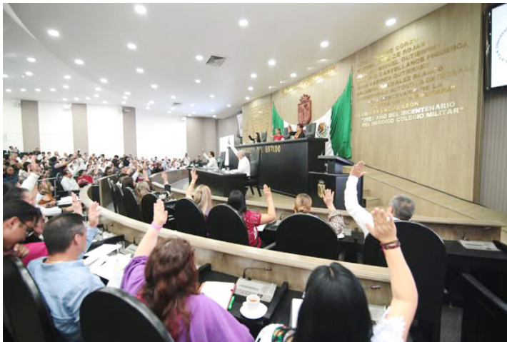
LA DISTINCIÓN busca reconocer y visibilizar el esfuerzo y la dedicación de personas que, con su trabajo y compromiso.

de 2026, y los interesados podrán presentar sus candidaturas ante el Congreso del Estado de Chiapas, cumpliendo con los requisitos establecidos en la convocatoria oficial.