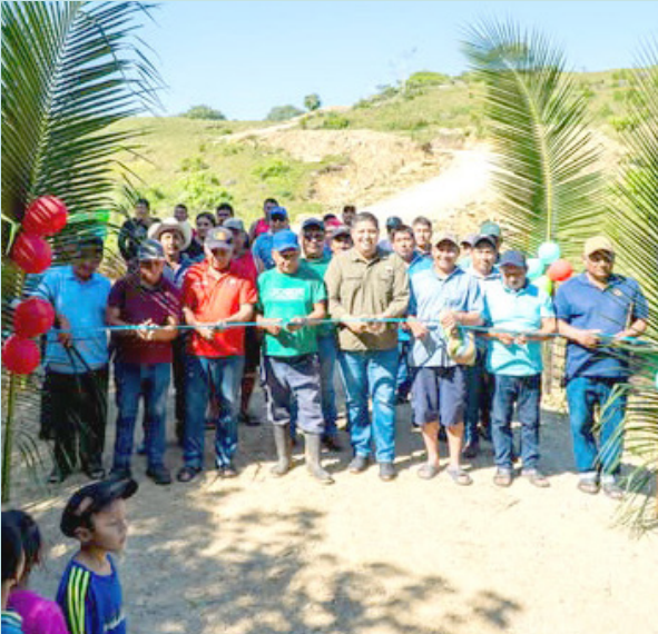
CON ESTAS acciones se fortalece la infraestructura productiva, mejorando las vías de acceso a las parcelas y facilitando el traslado y la comercialización de las cosechas.

La obra consistió en el engravado de 3 mil metros lineales de camino cosechero, así como la construcción de vados reforzados con malla LAC. Para la ejecución de estos trabajos se destinó una inversión de 1 millón 410 mil 506 pesos con 71 centavos.