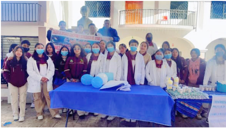
ESTUDIANTES DE Producción Industrial de Alimentos del CECyT 12 El Porvenir mostraron creatividad y compromiso con la calidad en la elaboración de productos con leche, frutas y hortalizas.

El evento también sirvió como un espacio de aprendizaje práctico, donde los estudiantes recibieron retroalimentación de docentes y expertos, fortaleciendo su formación técnica y su capacidad para desarrollar productos aptos para el consumo seguro.