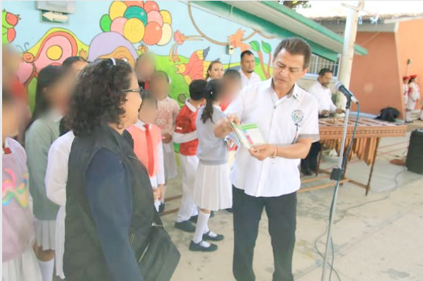
ESCUELAS, FAMILIAS y autoridades trabajan en conjunto para fortalecer la prevención y el cuidado de la salud de niñas y niños.

Con acciones simples pero fundamentales —como preguntar con empatía “¿Cómo te sientes hoy?”, fomentar la higiene, completar los esquemas de vacunación y actuar de manera oportuna ante cualquier síntoma— se fortalecen los hábitos saludables y se previenen posibles contagios o complicaciones.