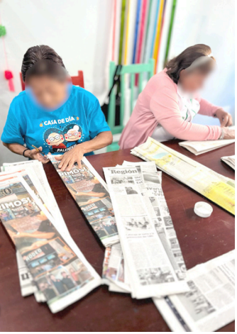
EL DIF Palenque da la bienvenida a las adultas mayores en la Casa de Día, con terapias funcionales y dinámicas para fortalecer su bienestar integral.

El alcalde aseguró que continuarán trabajando con responsabilidad, transparencia y dedicación, para garantizar que el desarrollo llegue a todos los rincones de Palenque, fortaleciendo la cercanía entre gobierno y sociedad.