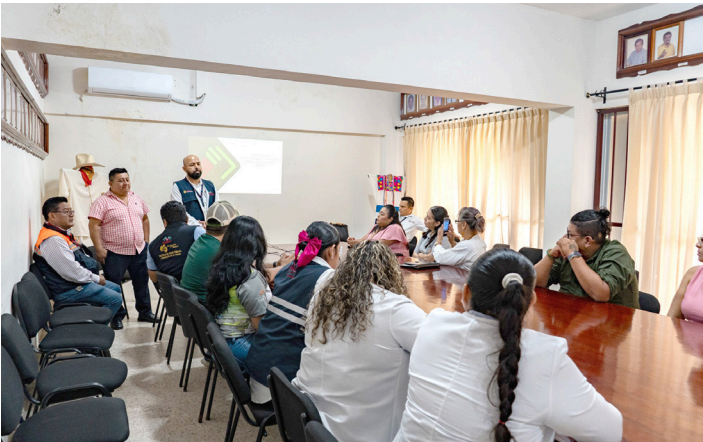
AUTORIDADES BUSCAN coordinación interinstitucional para prevenir adicciones y promover el bienestar social.

to y la participación activa de distintos sectores de la sociedad, se busca implementar estrategias integrales que reduzcan factores de riesgo, fomenten estilos de vida saludables y contribuyan al desarrollo social con un enfoque humano, preventivo y de responsabilidad compartida.