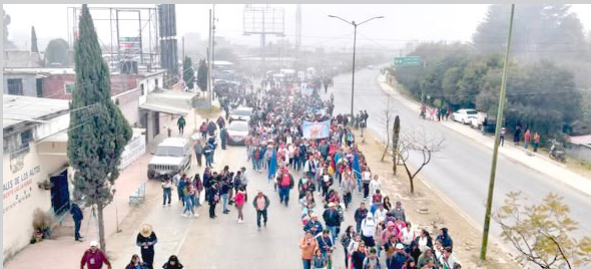
LA PARROQUIA Santo Domingo de Guzmán se sumó al evento del Pueblo Creyente, promoviendo la fe y la unidad.

La Parroquia Santo Domingo de Guzmán, de Palenque, participó activamente en la Peregrinación del Pueblo Creyente realizada en San Cristóbal de las Casas, un encuentro que reúne a comunidades y fieles de distintas regiones del estado. Durante la peregrinación, los asistentes compartieron momentos de oración, reflexión y convivencia,