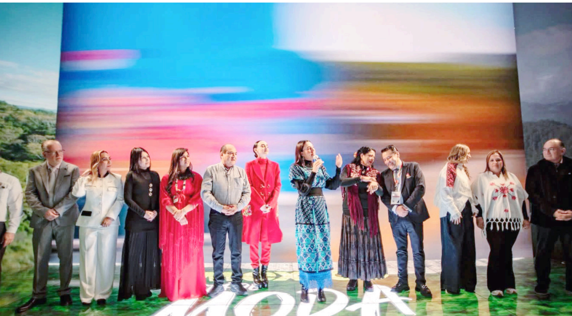
DESDE FITUR, Chiapas fue confirmado como parte de la ruta oficial de la Carrera Panamericana 2026, fortaleciendo su proyección turística internacional.