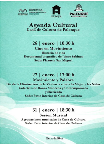
LA CASA de Cultura ofrece actividades artísticas y formativas para visitantes, familias y turistas.

Con esta iniciativa, se busca brindar a visitantes, familias y turistas momentos de aprendizaje y recreación, promoviendo al mismo tiempo el talento de los jóvenes palencanos y la riqueza cultural de la comunidad.