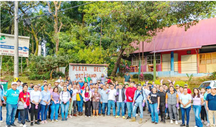
ESTA INICIATIVA, tuvo como objetivo principal fomentar la conciencia ambiental, fortalecer la cultura del cuidado del entorno y ofrecer a la ciudadanía espacios limpios, seguros y dignos.