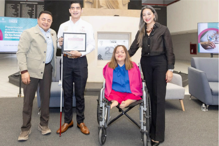
LA CONSTITUCIÓN en sistema Braille ya está disponible en la Biblioteca del Poder Judicial del Estado.

Con estas acciones, los tres Poderes del Estado refrendan su trabajo coordinado para avanzar juntos por el bienestar de las y los chiapanecos, fortaleciendo una justicia más cercana, equitativa y con sentido humano.