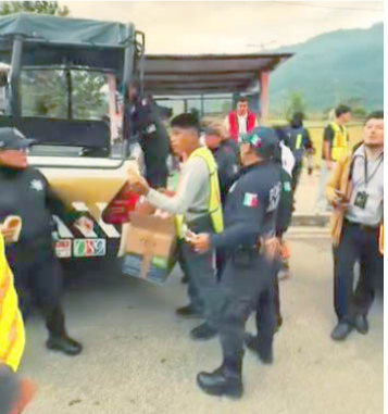
CORPORACIONES DE seguridad y auxilio unieron esfuerzos para brindar apoyo a personas en situación de calle y hospitales.

La Dirección de Seguridad Pública Municipal de Yajalón, en coordinación con Protección Civil, Tránsito Municipal, la Secretaría de la Defensa Nacional (SEDENA) y la Fiscalía Selva, llevó a cabo la actividad denominada “Ayuda Humanitaria para personas en situación de Calle y Hospitales”, con el objetivo de atender a los sectores más vulnerables del municipio. Durante la jornada, las corporaciones participantes realizaron recorridos y acciones solidarias para brindar apoyo directo a personas en situación de calle, así como a pacientes y familiares en hospitales, priorizando