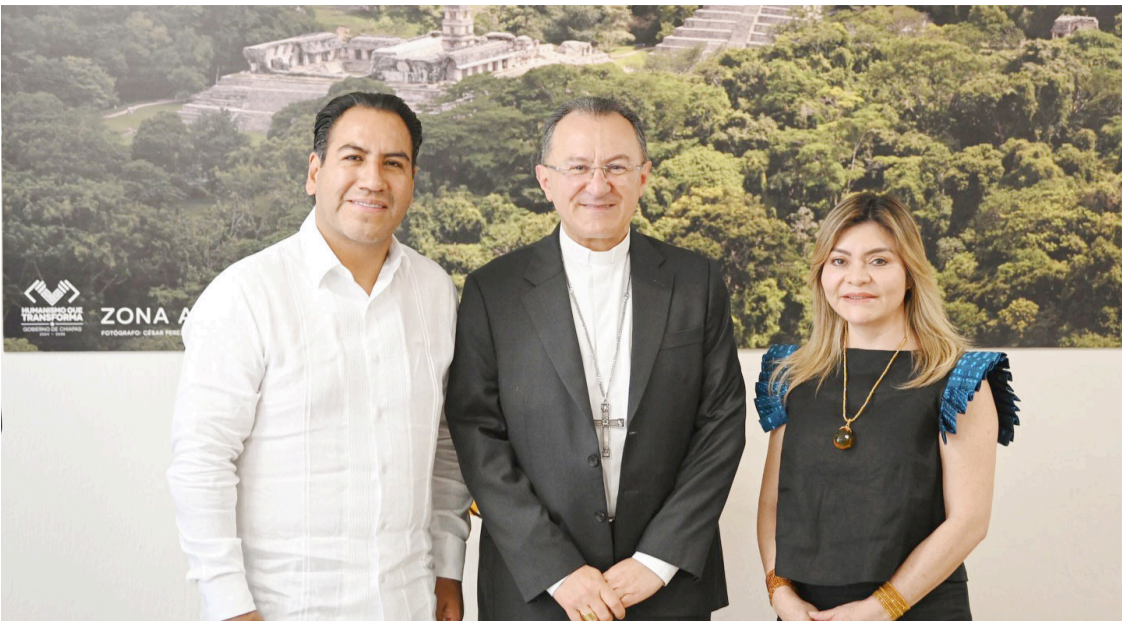
EL MANDATARIO estatal destacó la riqueza cultural y lingüística de Chiapas durante el encuentro.

respuesta médica. Asimismo, se llevaron a cabo evacuaciones aeromédicas preventivas de pacientes que requerían valoración especializada, quienes fueron trasladados al Hospital Básico Comunitario IMSS Bienestar de Ocosingo para su atención oportuna. Estas acciones contribuyen a salvar vidas, reducir riesgos y garantizar el derecho a la salud, reafirmando el compromiso de las autoridades de brindar atención médica eficiente y humana, incluso en las regiones más apartadas del estado.