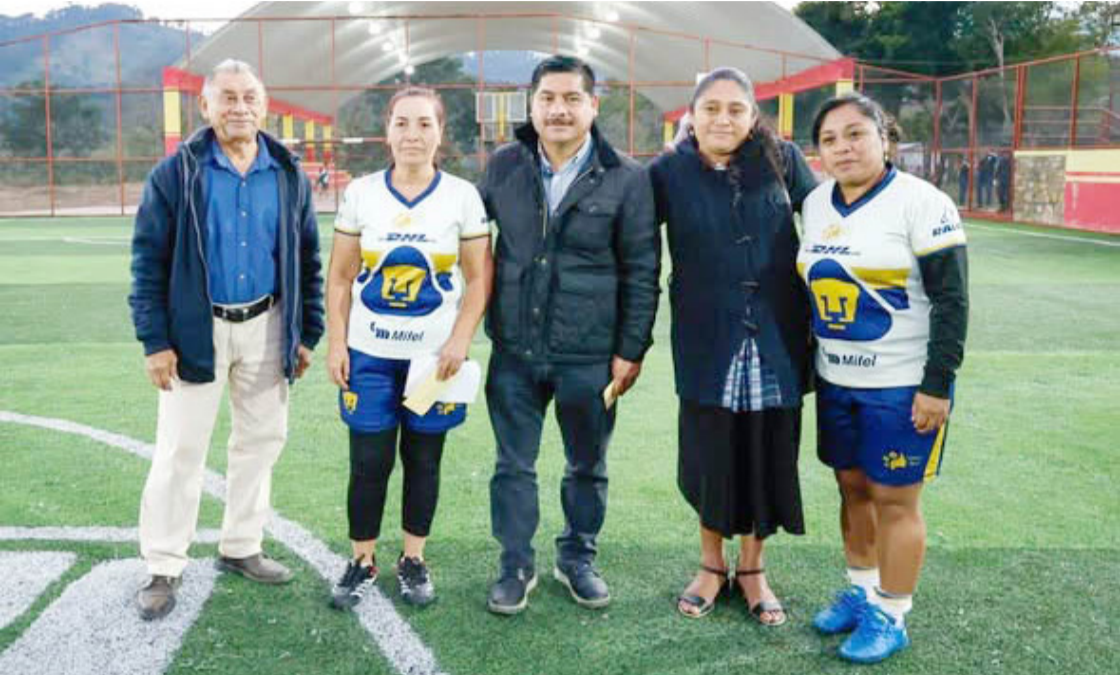
DURANTE LA jornada se disputaron intensos encuentros en distintas categorías.