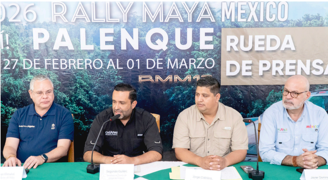
AUTORIDADES ESTATALES y municipales presentaron las actividades y ruta del magno evento turístico-deportivo.

El amor proclama que toda vida tiene valor y que cada historia puede ser redimida. No busca aplausos ni recompensas; su sentido está en dar vida, en restaurar vínculos, en reconciliar lo humano con lo divino. En el fondo, el amor es una llamada. Invita a vivir para los demás, a convertir el dolor en servicio y la fe en acción. Amar es, entonces, participar en una obra mayor: sembrar justicia, sostener la esperanza y recordar, con cada acto, que el amor es el camino.