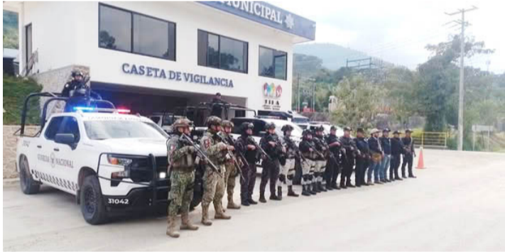
AUTORIDADES MUNICIPALES y fuerzas de seguridad mantienen recorridos preventivos para fortalecer la paz social en el municipio.