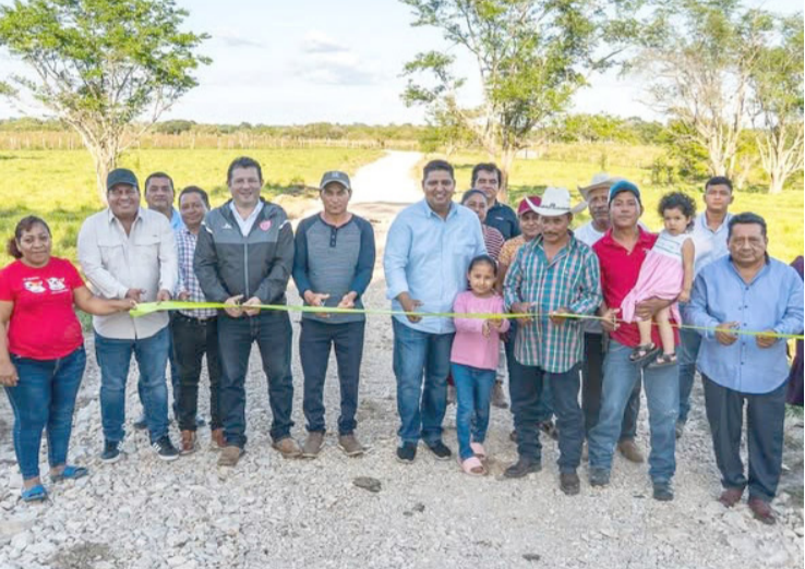
ESTA OBRA consistió en la rehabilitación de 1,080 metros lineales, con una inversión total de 1 millón 187 mil 874 pesos con 49 centavos.