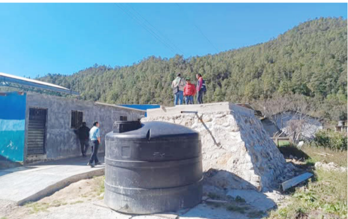
AUTORIDADES DE salud realizaron acciones integrales para prevenir riesgos y cuidar el bienestar de la población.