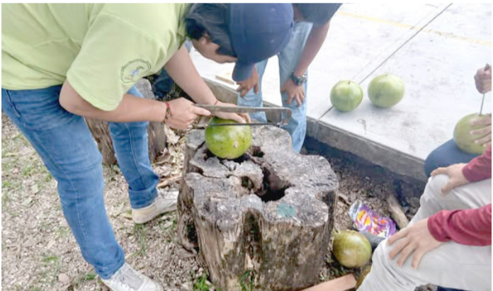
ESTUDIANTES CONOCEN técnicas tradicionales y la cosmovisión maya a través de la cerámica.

Para mayores informes y recepción de documentos, las parejas pueden acudir a las oficinas del DIF Municipal, ubicadas en la calle Francisco Javier Mina, Parque de Feria, en un horario de atención de 8:00 de la mañana a 4:00 de la tarde, de lunes a viernes.