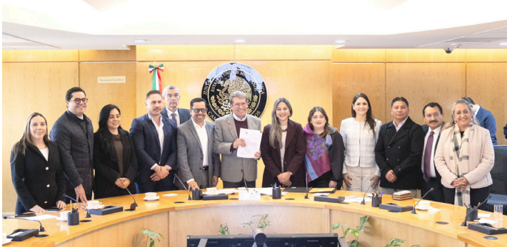
EL CONGRESO del Estado entrega iniciativa al Congreso de la Unión para fortalecer la seguridad pública.

forzando las medidas preventivas y la protección del municipio.