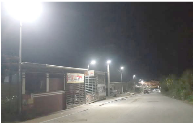
LA OBRA mejora la seguridad y el tránsito peatonal en el tramo del Arco al Hospital.

Autoridades municipales señalaron que el mantenimiento y rehabilitación de espacios públicos forma parte de una estrategia integral para mejorar