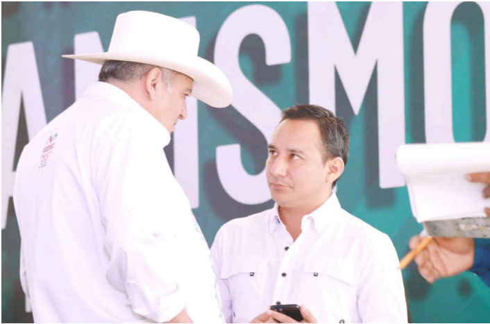
AUTORIDADES MUNICIPALES refrendan su respaldo a programas que priorizan el bienestar social.