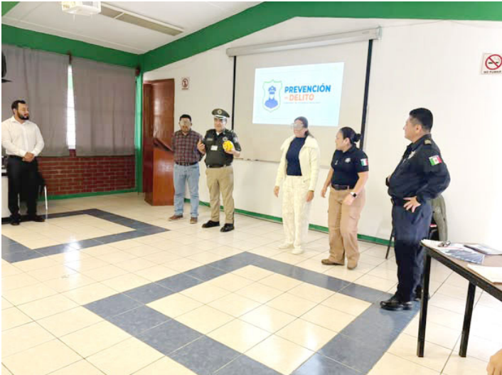
AUTORIDADES MUNICIPALES refuerzan la prevención de accidentes y la cultura del respeto a las normas de tránsito.