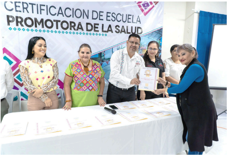
AUTORIDADES DESTACAN el impulso a entornos escolares saludables en coordinación con el sector salud.