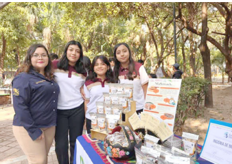
ESTUDIANTES PARTICIPAN en actividades por el Día Internacional de la Mujer y la Niña en la Ciencia.

Durante la jornada se realizaron diversas actividades orientadas a promover el interés por la