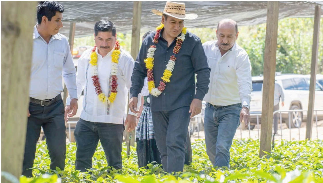
EL VIVERO de café Santa Anita, en la comunidad de Pokil, del municipio de Chilón fue sede del arranque del Programa Estatal de “Café con Humanismo”.

El 10 de febrero se celebra el Día Mundial de las Legumbres, una fecha relativamente reciente. Se estableció como efeméride reconocida en diciembre de 2018 y se celebró por primera vez en 2019. La ONU junto con la FAO, su organismo dedicado a la alimentación y agricultura, ha venido promoviendo la importancia de las legumbres desde el año 2016, que fue el Año Internacional de las Legumbres.