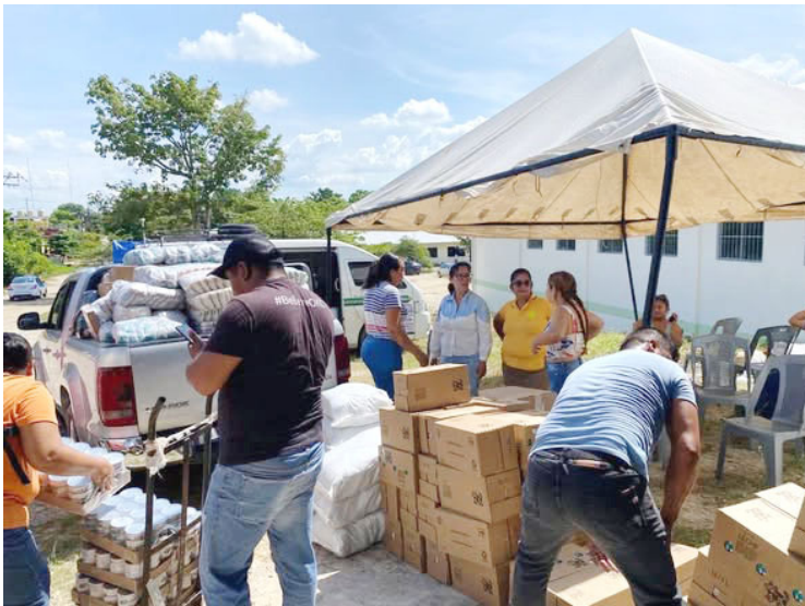
AUTORIDADES MUNICIPALES refrendan su compromiso con la educación y el bienestar infantil.

Otro de los beneficios señalados es el apoyo a la permanencia escolar, especialmente en comunidades que enfrentan