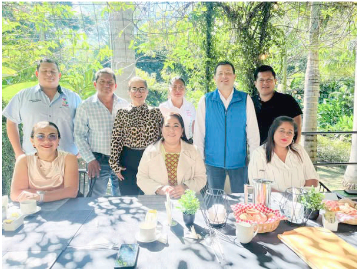
ICATECH CATAZAJÁ y presidentas de los DIF municipales refuerzan la colaboración interinstitucional en la región.