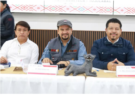
MUNICIPIOS COORDINAN esfuerzos para mejorar hospitales y fortalecer la prevención sanitaria.

importancia de la colaboración intermunicipal para atender de forma oportuna los retos en salud pública, así como para garantizar servicios médicos más eficientes y de mayor calidad.