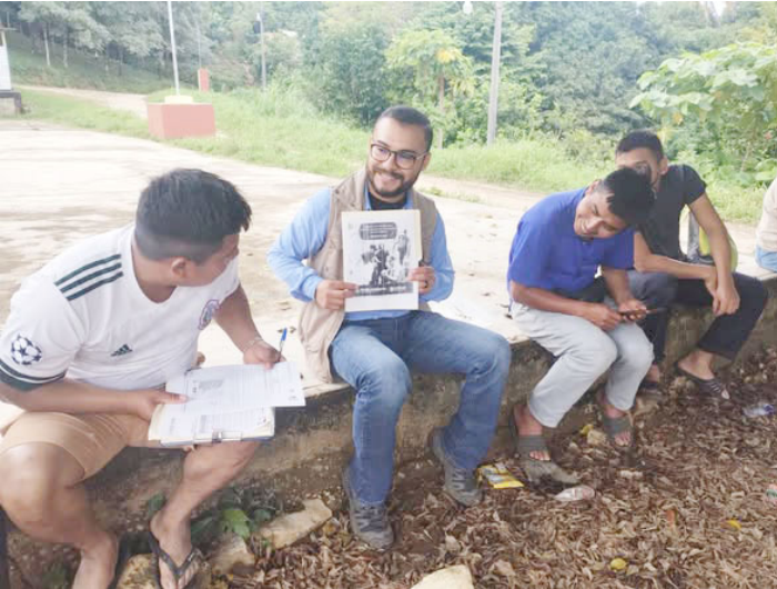
LA CONANP impulsa acciones de restauración ambiental rumbo al ejercicio fiscal 2026.