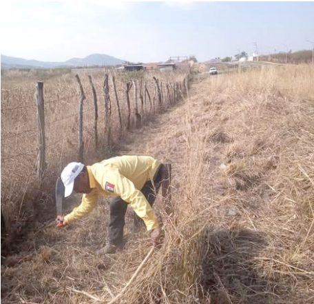
PROTECCIÓN CIVIL realiza brechas cortafuego y quemas controladas para reducir riesgos en temporada de estiaje.

Con ello, se busca evitar que incendios accidentales se propaguen sin control durante la temporada de estiaje, re-