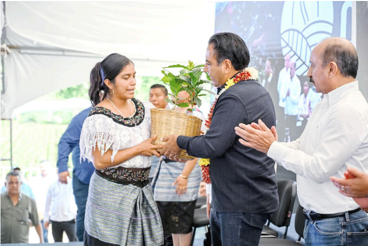
EL PROGRAMA beneficiará a más de 25 mil familias cafeticultoras de 87 municipios del estado.

Como parte de los apoyos, se entregarán insumos fundamentales para la actividad cafetalera, entre ellos despulpadoras, herramientas y la instalación de un vivero, lo que permitirá que en el mes de mayo inicie el proceso de siembra en diversas regiones del estado.