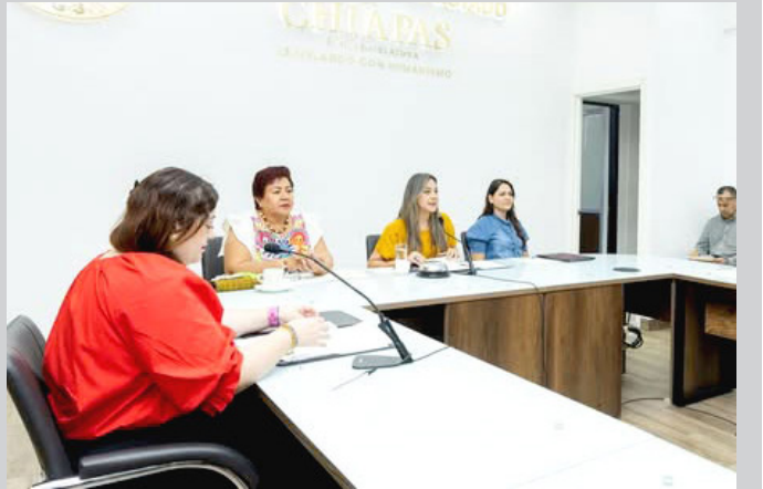
LA COMISIÓN Permanente dio trámite a solicitudes de límites territoriales y a propuestas para otorgar medallas que distinguen el mérito y compromiso social.