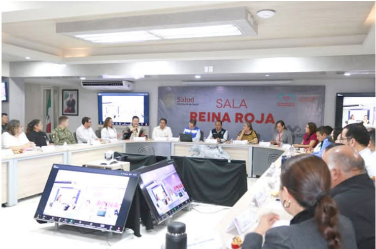
EN ESTA reunión se expuso que en 2025 la entidad logró reducir la mortalidad materna en un 10 por ciento en comparación con 2024.