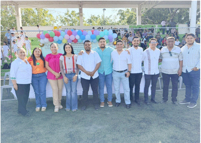
ESTE TIPO de eventos tiene como principal objetivo fomentar valores fundamentales como el respeto, la disciplina, el trabajo en equipo y la

ñalaron que el objetivo es fomentar la unión y el sano esparcimiento entre las familias palencanas, generando espacios de alegría y fortaleciendo los lazos comunitarios.