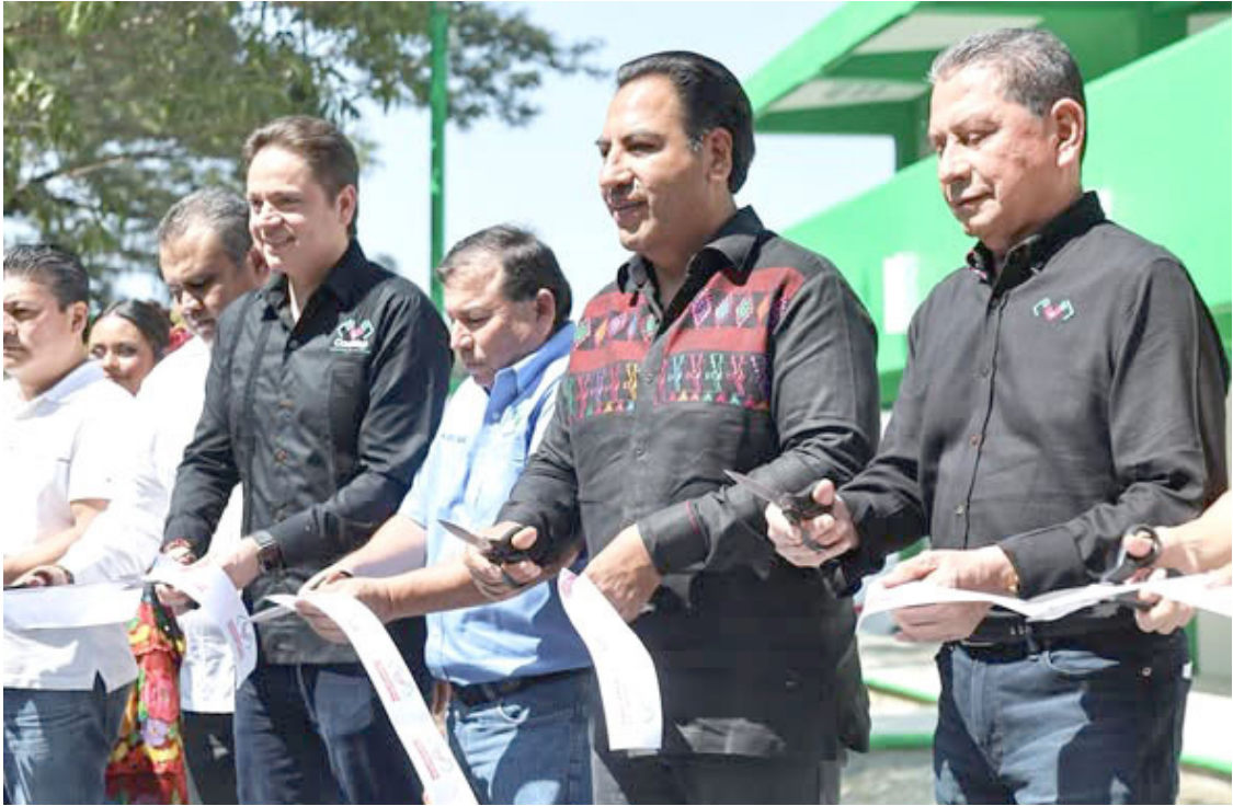
TAMBIÉN ENTREGÓ nuevas aulas en el Conalep plantel 22, beneficiando a cerca de mil estudiantes con mejores espacios educativos.