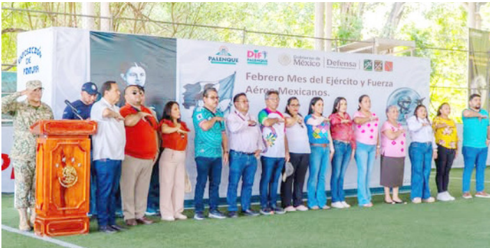
AYUNTAMIENTO, FUERZAS de seguridad y Mesa Regional participan en torneo de fútbol rápido como estrategia de prevención social.