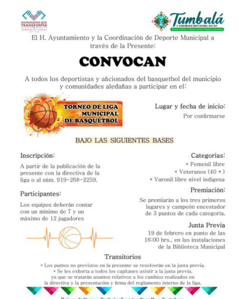
EL AYUNTAMIENTO y la Coordinación de Deporte convocan a equipos locales a sumarse al torneo y fortalecer la convivencia y el talento deportivo en el municipio.

El certamen también tiene como objetivo promover estilos de vida saludables y generar espacios de convivencia familiar, donde la afición al depor-