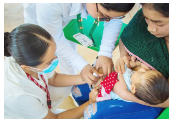
AYUNTAMIENTO E IMSS realizan campaña con biológicos SR y SRP para prevenir el sarampión y completar esquemas de vacunación.

tacaron que estas acciones forman parte del compromiso de trabajar de manera conjunta con las instituciones de salud para salvaguardar el bienestar de las familias tilenses, fortaleciendo la cultura de la prevención y el cuidado oportuno.