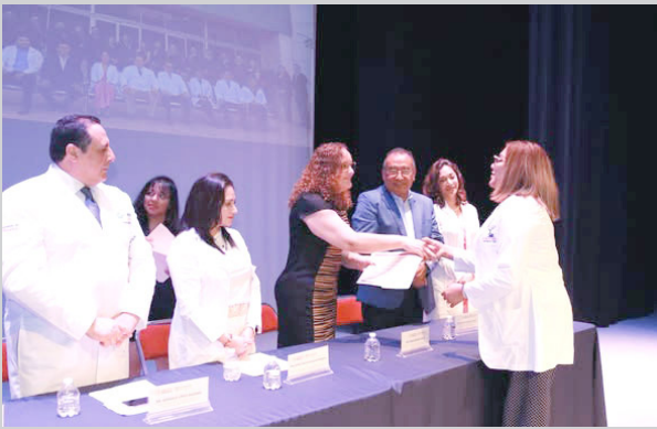
RESIDENTES DEL Hospital General “Dr. Jesús Gilberto Gómez Maza” concluyen su formación con aval de la UNACH.

En representación del secretario de Salud del es-