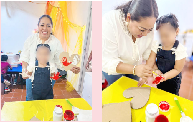
NIÑAS Y niños del CAIC “Niños Felices” conmemoraron el Día del Amor y la Amistad con actividades llenas de alegría y valores.