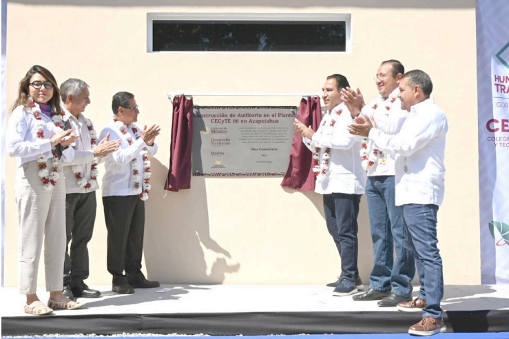
EL MANDATARIO estatal destacó que estas acciones responden a las necesidades planteadas por la ciudadanía.

“Escuchamos las necesidades del pueblo, por ello estamos fortaleciendo la infraestructura del estado, trabajando muy coordinados con la Federación para garantizar el desarrollo de