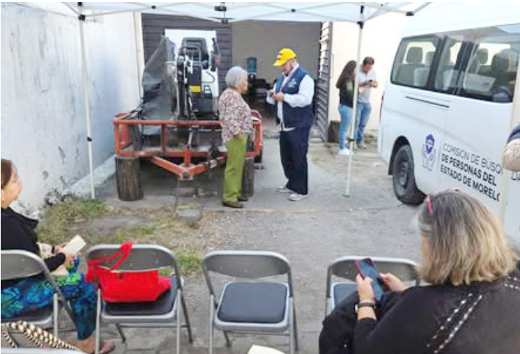
COLECTIVOS DESTACAN la importancia de completar muestras para agilizar posibles identificaciones.

Familiares de personas desaparecidas integran perfiles genéticos a la base de datos nacional