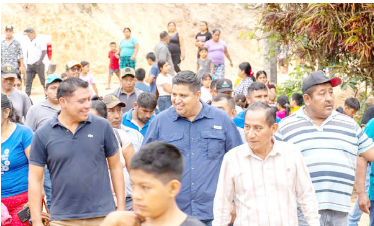
EL AYUNTAMIENTO invirtió más de 1.1 millones de pesos en obra social para mejorar la vivienda en la colonia 11 de Julio.