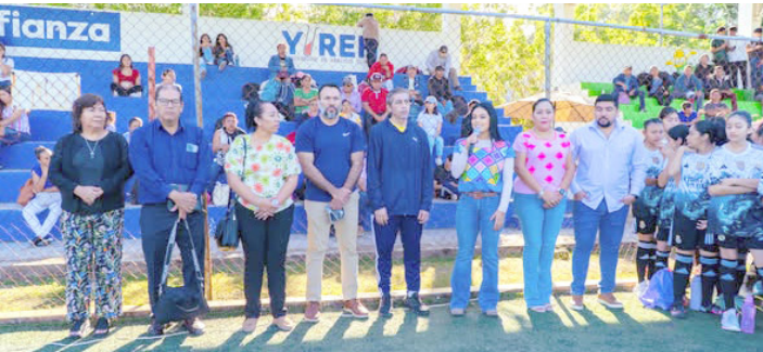
AUTORIDADES MUNICIPALES destacan el deporte como pilar en la formación integral de la juventud palenquense.