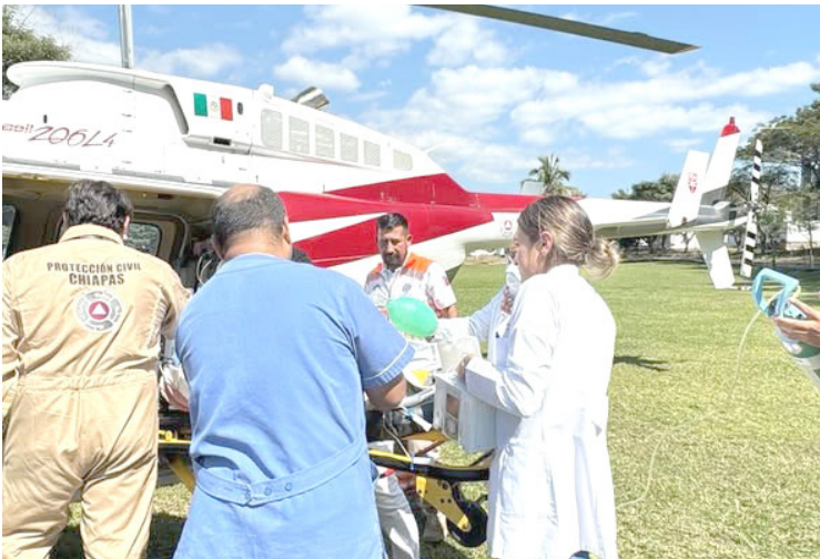
RESCATE AÉREO moviliza a paciente de Ocosingo a Tuxtla Gutiérrez bajo cuidados intensivos obstétricos.