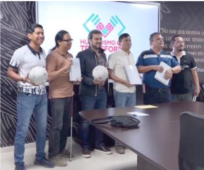
INTEGRANTES DE Balam Chiapas FC se reúnen con el secretario de Educación para fortalecer proyectos de inclusión y deporte adaptado.