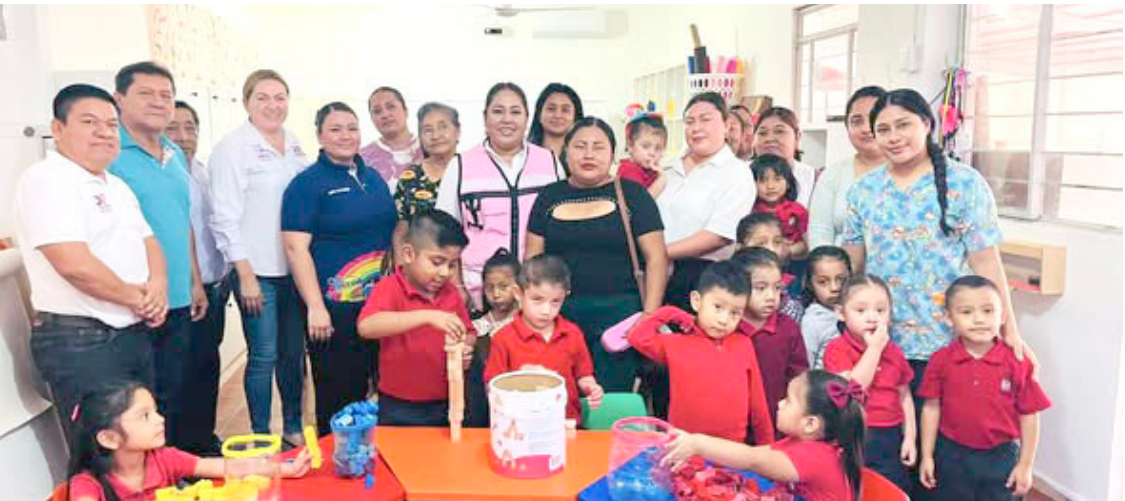
EL DIF Municipal de Palenque entregó equipamiento para mejorar las áreas de cocina y aula educativa, en beneficio de la niñez.