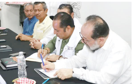
REFUERZAN LA coordinación entre dependencias, sociedad civil y organismos internacionales, y garantizar atención integral a personas en contexto de movilidad.

Durante este encuentro se destacó la importancia de optimizar la calidad de los servicios médicos, así como impulsar mecanismos de atención con enfoque intercultural, especialmente en municipios fronterizos como Tapachu-