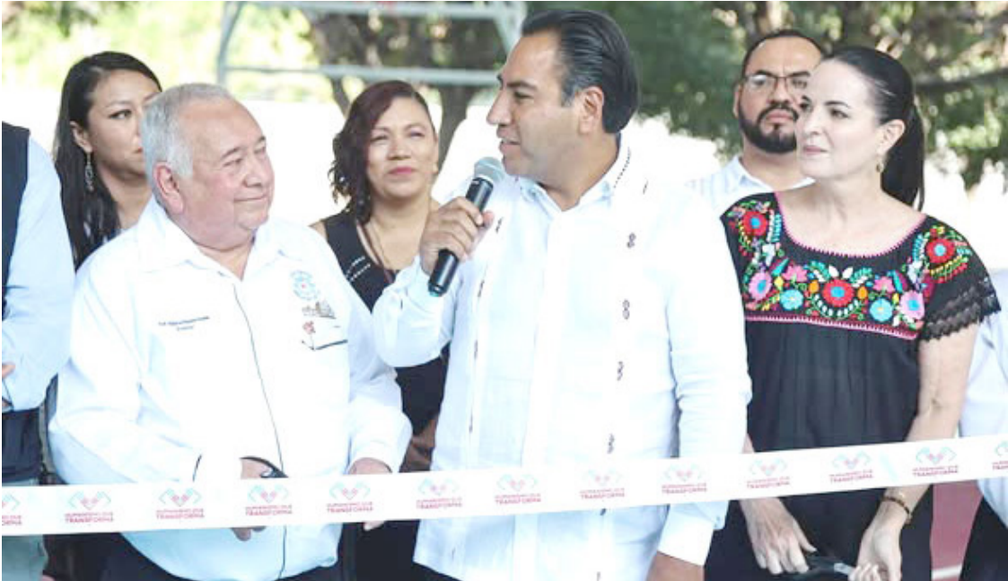
EL MANDATARIO destacó que su gobierno apuesta por espacios dignos para fortalecer el aprendizaje y el desarrollo de la juventud.