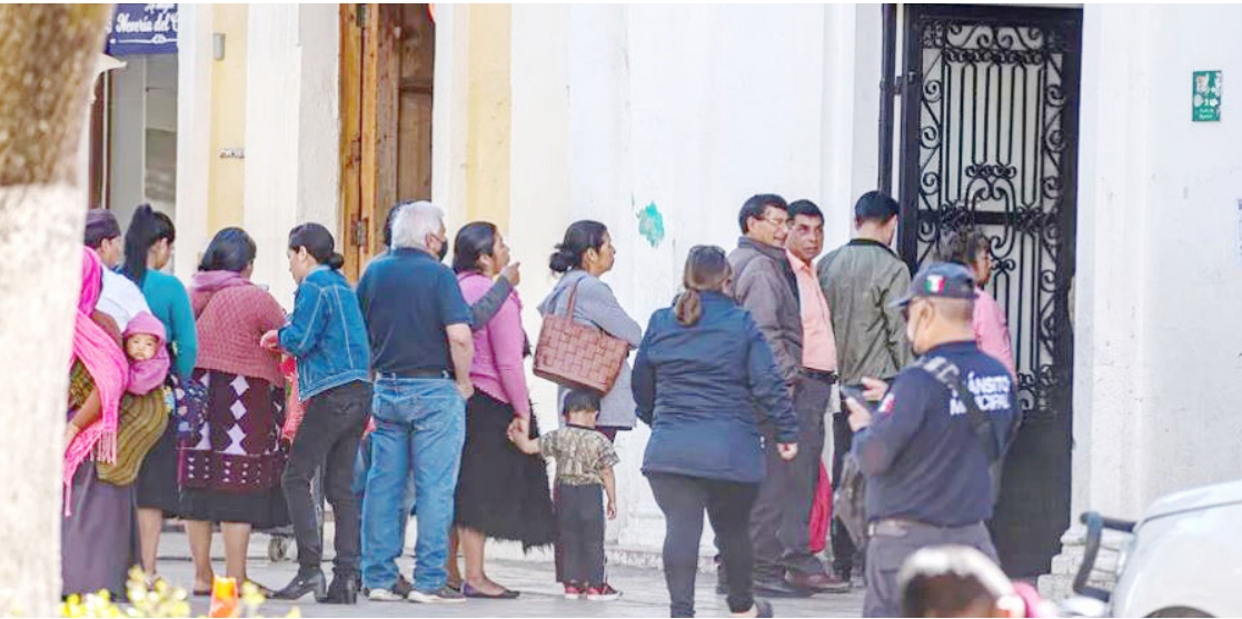
LOS PRINCIPALES municipios receptores de remesas en la entidad son San Cristóbal de Las Casas, Comitán de Domínguez y Tuxtla Gutiérrez.