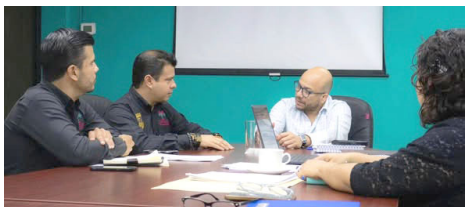
AUTORIDADES EDUCATIVAS sostienen reunión para fortalecer la calidad y certificación de trayectos formativos en el estado.

El encuentro tuvo como propósito principal impulsar la certificación de los trayectos formativos que ofrece dicha institución, así como fortalecer la calidad de los procesos de profesionalización que se brindan a las y los participantes, en concordancia con las políticas educativas vigentes en la entidad.