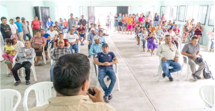
OBRA CON una inversión de más de 1.8 millones de pesos en la construcción de un espacio destinado a fortalecer la convivencia y el bienestar social en el ejido.

nadas a fortalecer la igualdad, la participación activa y el desarrollo deportivo en el municipio, promoviendo espacios donde las mujeres puedan demostrar su capacidad y liderazgo. Con este encuentro, el Ayuntamiento reafirma su compromiso de seguir impulsando iniciativas que fomenten la inclusión y el empoderamiento femenino a través del deporte, invitando a las familias palencanas a sumarse y apoyar a las atletas en esta significativa celebración.