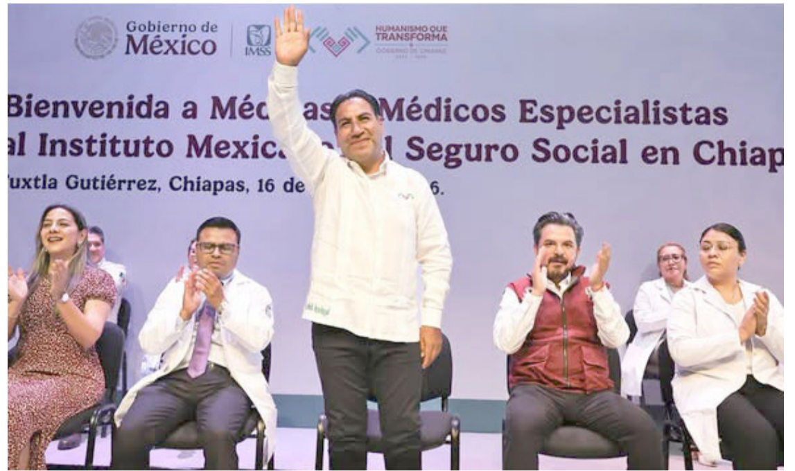
EL DIRECTOR del IMSS, Zoé Robledo, agradeció la colaboración del gobernador Eduardo Ramírez en este programa.