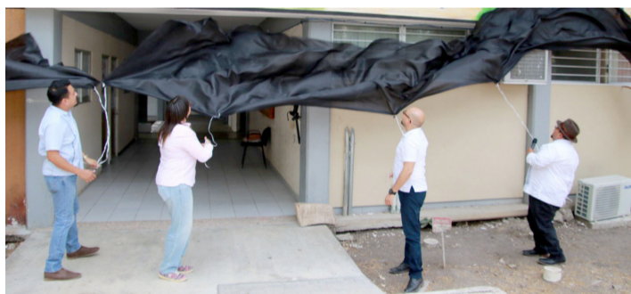
LA OBRA destaca la identidad estatal desde una visión humanista y cultural.

Autoridades señalaron que la historia de Chiapas también se construye desde el arte, al convertirse en un vehículo para la reflexión, la identidad y el reconocimiento de la diversidad cultural del estado.