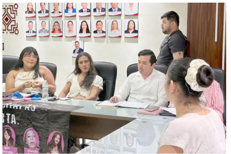
EL CONGRESO de Chiapas refuerza su compromiso con la inclusión y los derechos humanos.

Durante la jornada, se compartieron los avances legislativos impulsados en favor de la comunidad LGBTTTIQ+, reafirmando el compromiso del Poder Legislativo con el respeto, la inclusión y la defensa de los de-