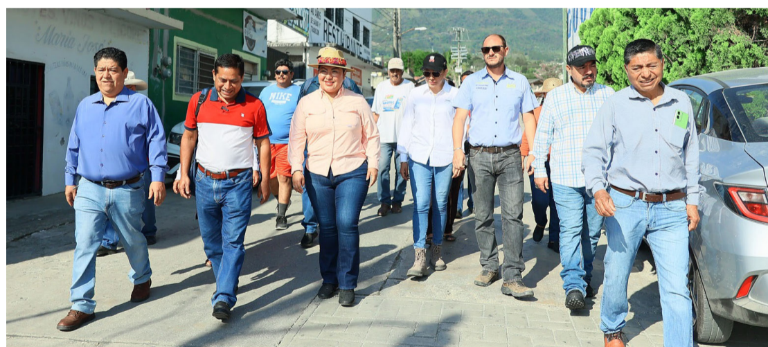
LA PRESIDENTA municipal de Ocosingo dialoga con vecinos para atender sus necesidades de manera directa.

La entrega de insumos y herramientas refleja el compromiso de la administración de Chilón con el fortalecimiento de la economía local y el bienestar de las familias.