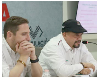
EL GOBIERNO estatal impulsa políticas para reducir la desigualdad en la atención médica.

Gómez Cruz destacó que estas acciones buscan universalizar los servicios de sa-