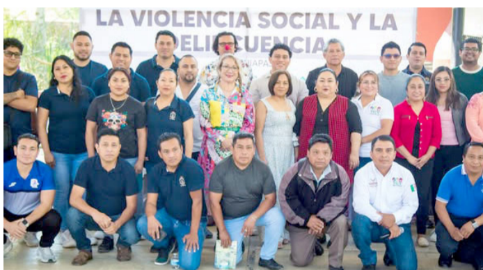
AYUNTAMIENTO Y organismos estatales capacitan a escuelas para fomentar entornos seguros y valores entre estudiantes.