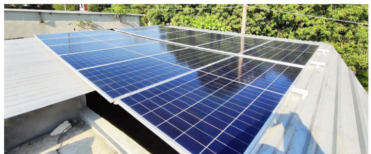
EN DISTINTOS hogares y comercios se ha comenzado a buscar otras opciones ante el aumento en el recibo de luz de CFE.

Sin embargo, también existe debate entre la población, ya que mientras algunos ven esta tecnología como una solución viable, otros comentan que la inversión inicial aún representa un reto importante para muchas familias y pequeños negocios.