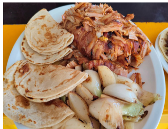
EL INCREMENTO de hasta cinco pesos en el kilo impacta los costos operativos en Palenque.

El aumento de hasta 5 pesos en el precio de la tortilla en distintos puntos de venta ya comienza a impactar directamente a los taqueros de Palenque, quienes enfrentan una situación complicada mientras intentan no trasladar el golpe al cliente.