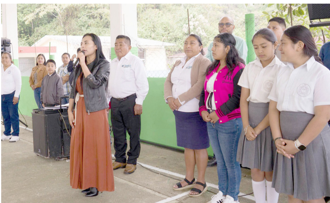
LA OBRA beneficiará directamente a estudiantes al brindar condiciones seguras y funcionales para sus actividades.