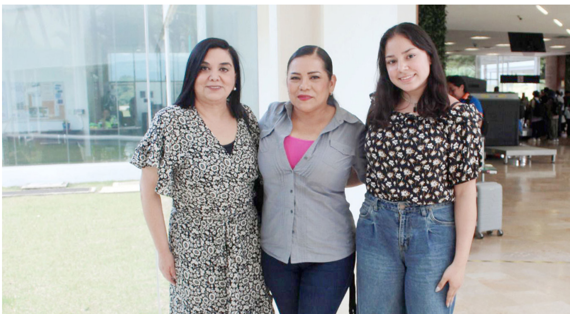
DESDE EL AEROPUERTO INTERNACIONAL de Palenque, autoridades anuncian jornadas de formación para mejorar la atención al visitante.