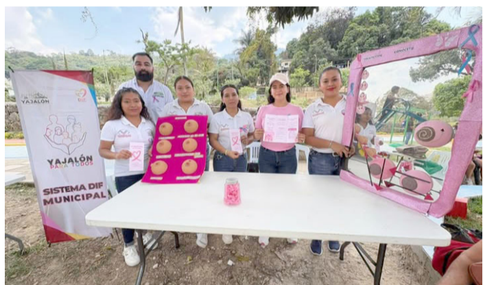
EL DIF Municipal promueve la concientización y la detección oportuna entre mujeres del municipio.

Autoridades municipales agradecieron la participación de la ciudadanía en este logro, reiterando que el trabajo conjunto es clave para continuar construyendo entornos más seguros en beneficio de todas y todos los habitantes de Abasolo.