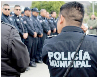
ESTE NÚMERO 916 129 33 66, permitirá a la población comunicarse directamente con elementos de seguridad para reportar.

En situaciones de emergencia, saber a quién llamar puede marcar la diferencia. Casos como violencia doméstica, conflictos vecinales o situaciones de riesgo requieren atención inmediata y el acceso a números confiables que permitan recibir apoyo oportuno.