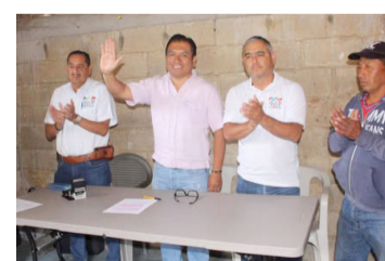
EL ALCALDE Neiser Hernández López encabezó un encuentro con comunidades rurales para definir prioridades en obra social.

El objetivo de esta reunión fue priorizar las demandas en materia de obra social, a fin de planificar acciones que permitan mejorar la infraestruc-