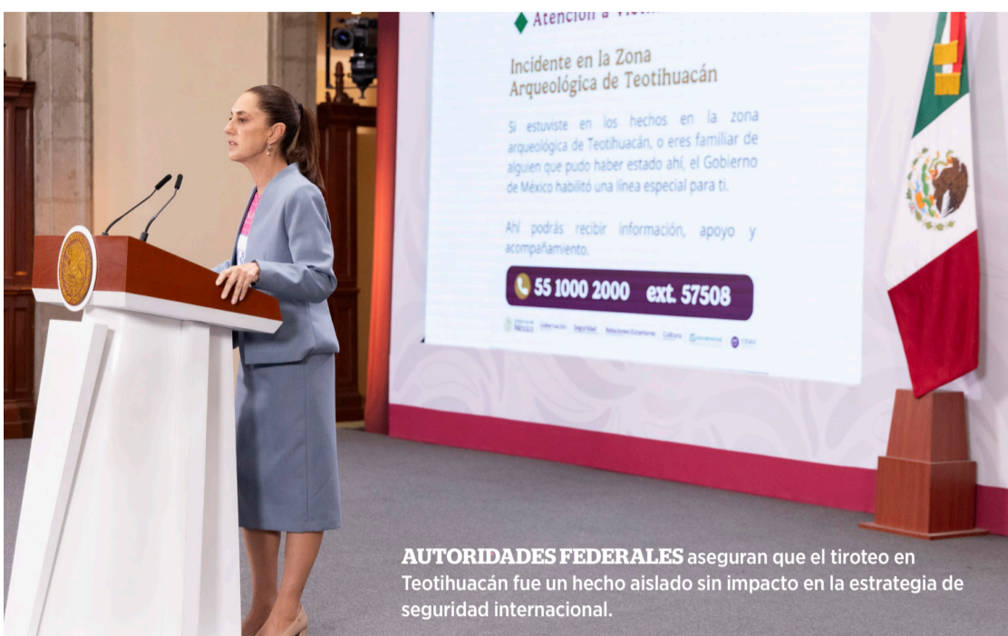
AUTORIDADES FEDERALES aseguran que el tiroteo en Teotihuacán fue un hecho aislado sin impacto en la estrategia de seguridad internacional.