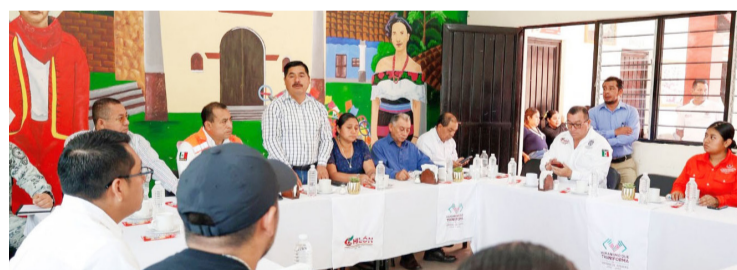
AUTORIDADES MUNICIPALES coordinan acciones preventivas para proteger a la población durante la temporada pluvial.