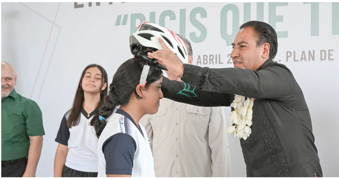
EL MANDATARIO estatal impulsa movilidad sustentable y apoyo educativo en Tuxtla.