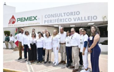
PEMEX AVANZA en la transformación de su sistema de salud, fortalece su infraestructura, moderniza su equipamiento y garantiza atención médica digna.

El programa que arrancó hoy con la adecuación del nuevo Consultorio Periférico Vallejo, incluye a las 60 unidades médicas que conforman el sistema de salud de Pemex, en donde se realizarán acciones de mantenimiento de equipos biomédicos hasta la atención mayor y la renovación de inmuebles, con trabajos de rehabilitación de espacios, modernización eléctrica, sustitución de luminarias, calderas o sistemas de enfriamiento; impermeabilización o las adecuaciones funcionales que se requieran, para elevar la calidad de los servicios.