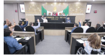
EL CONGRESO Estatal fue el tercero en todo el país, que propone un marco jurídico de avanzada al homologar dicha ley.