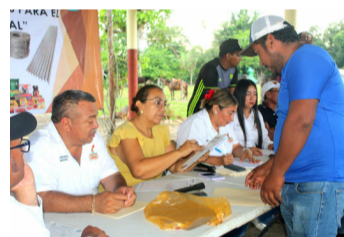
AUTORIDADES MUNICIPALES entregan apoyos directos para fortalecer la economía familiar y productiva.

nibles se encuentran tinacos de 1100 litros, molinos eléctricos, malla avícola, piso firme, techo firme, alambre de púas y láminas onduladas, con el objetivo de mejorar tanto las condiciones de vida como las actividades productivas en el campo.