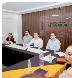
CAPACITACIÓN BUSCA mejorar el compromiso institucional y la atención a derechohabientes.

llevó a cabo la capacitación denominada "Identidad Institucional en el ISSTECH", con el objeti-