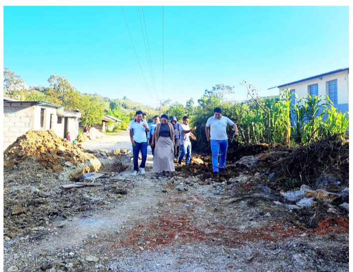
LA ALCALDESA recorre localidades para verificar avances y atender de cerca las necesidades de la población.