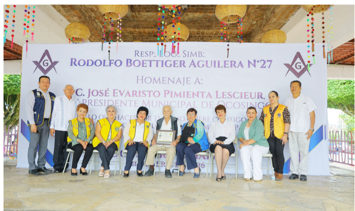
AUTORIDADES MUNICIPALES acompañan homenaje a ex alcalde por su labor en favor del desarrollo local.

El 23 de abril se celebra el Día del Idioma Español con el objetivo de reconocer la riqueza cultural e histórica de cada uno de los idiomas oficiales de la Organización de las Naciones Unidas. La ONU introdujo en 2010 en su calendario de celebraciones los días dedicados a las lenguas oficiales para promover la diversidad cultural y el multilingüismo. Se eligió el 23 de abril para celebrar la lengua española porque coincide con el aniversario de la muerte de Miguel de Cervantes Saavedra, autor de El Quijote, una de las obras más universales del mundo.