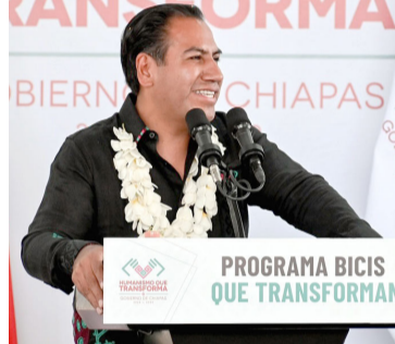
beneficiarios, al tiempo que contribuirán a mejorar su calidad de vida y desempeño escolar.

las bicicletas serán utilizadas con responsabilidad por parte de los