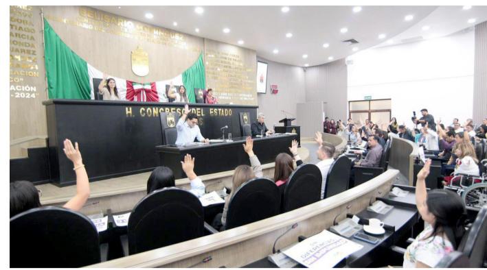
•AGENCIA: TUXTLA GUTIÉRREZ

La Sexagésima Novena Legislatura en el Congreso del Estado, atendiendo las políticas del humanismo y de pleno respeto a los derechos humanos, aprobó por urgente/obvia resolución, la minuta con proyecto de decreto propuesto por la presidenta de la República, Claudia Sheinbaum Pardo, por el que se reforma el artículo 73, fracción vigésima primera, inciso A, de la Constitución Política de los Estados Unidos Mexicanos en materia de feminicidio.