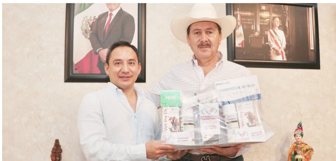
EL APOYO incluyó frascos de ivermectina, dosis de Lepecid, agujas, jeringas y trampas, insumos que permitirán proteger los hatos.