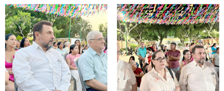
HOMENAJE AL poeta Ydalio Huerta Escalante, evento que reunió a artistas, estudiantes y ciudadanos.