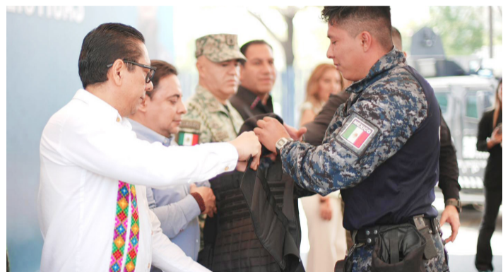
AUTORIDADES ESTATALES entregan equipo táctico para fortalecer la labor policial y la confianza ciudadana.

Con esta entrega, el Gobierno del Estado reafirma su compromiso con la construcción de la paz en Chiapas, mediante el fortalecimiento institucional y la mejora continua de las condiciones de trabajo de los cuerpos de seguridad.