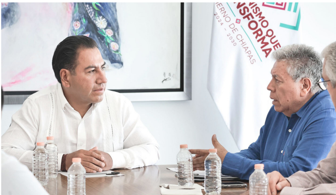
EL MANDATARIO busca ampliar la formación especializada en el sector agropecuario para responder a las necesidades de Chiapas y de la región Sur-Sureste.