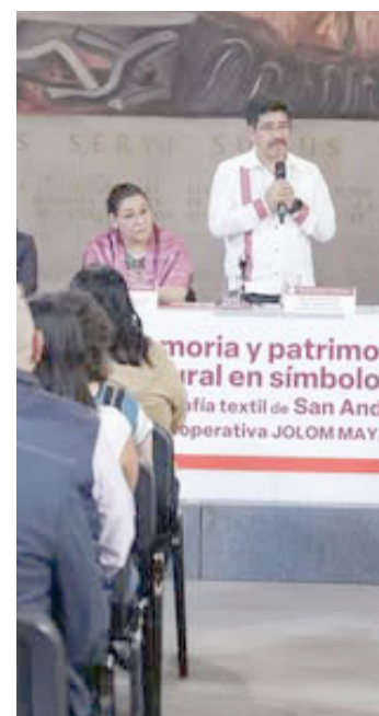
LA SUPREMA Corte de Justicia de la Nación inauguró una exposición que reconoce el patrimonio cultural y los saberes ancestrales de mujeres artesanas del sur de México.

A través de la recuperación y documentación de la iconografía textil, la muestra impulsa el reconocimiento de símbolos ancestrales como patrimonio cultural vivo, proyectando su importancia a nivel nacional e internacional.