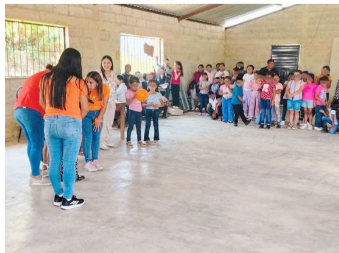
DIF CHILÓN impulsa con determinación estas iniciativas, promoviendo un mensaje claro de protección, equidad y prevención.

Esta activación fortalece los valores de paz y respeto en nuestra niñez, empoderando a las nuevas generaciones con herramientas para identificar, prevenir y denunciar cualquier forma de violencia, hacia un futuro más equitativo y protector.