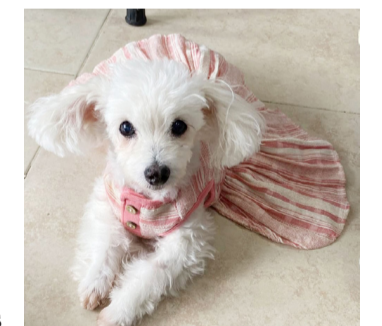
EMITEN RECOMENDACIONES para proteger a las mascotas del calor en Palenque

Asimismo, señalaron que entre los errores más comunes se encuentra dejar a las mascotas encerradas en espacios sin ventilación o sin acceso a agua fresca, lo que in-