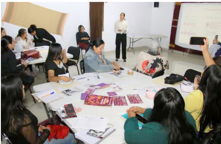
AUTORIDADES IMPULSAN capacitación a directivos escolares para fortalecer la detección y denuncia del abuso sexual infantil.

Con estas acciones, las autoridades reafirman su compromiso de proteger a la niñez y adolescencia, promoviendo espacios educativos más seguros y fortaleciendo la cultura de prevención, denuncia y atención integral.