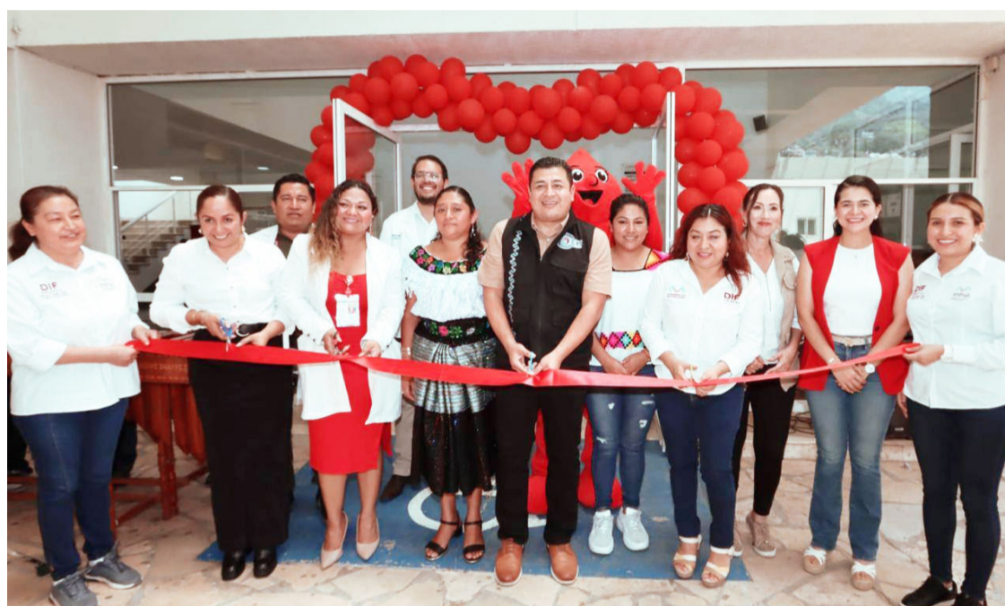
LA JORNADA , realizada en Yajalón, buscó fomentar la cultura de la donación voluntaria en beneficio de la salud pública.

EL DIF YAJALÓN, PARTICIPÓ EN LA 4TA CAMPAÑA DE DONACIÓN DE SANGRE EN COORDINACIÓN CON DIF CHIAPAS Y MUNICIPIOS DE LA DELEGACIÓN XIV TULIJÁ-TSELTAL-CHOL