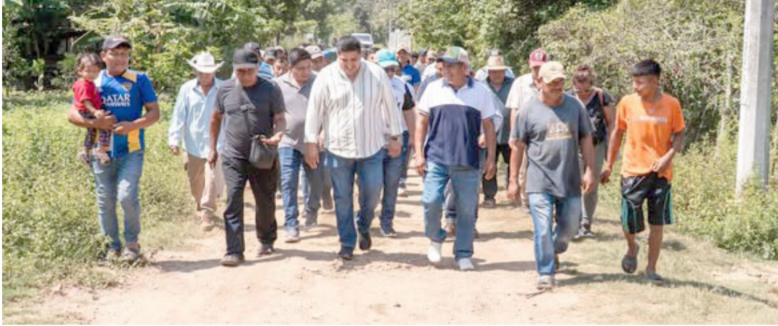
LA OBRA, con una inversión superior a 2.5 millones de pesos, refuerza el compromiso municipal con el desarrollo social y el acceso a servicios básicos.