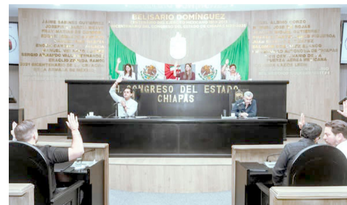
EL CONGRESO de Chiapas avaló modificaciones legales que permitirán a la Secretaría de Infraestructura ejecutar obras de dragado y desazolve.

Con estas acciones, Chiapas busca recuperar la funcionalidad hidráulica de sus sistemas costeros, mejorar la productividad pesquera y contribuir al desarrollo económico y social de las comunidades de la Costa, fortaleciendo uno de los sectores más importantes para la región.